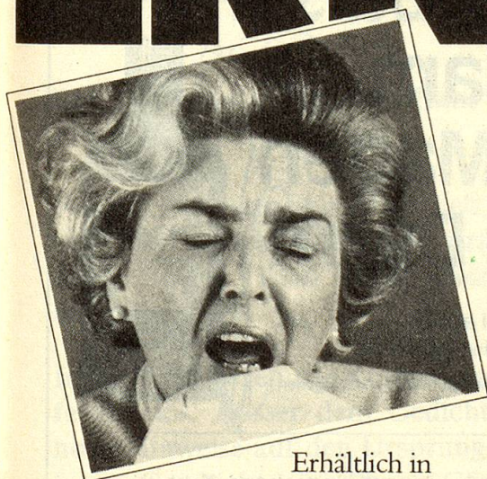
Erhältlich in Apotheken und Drogerien.