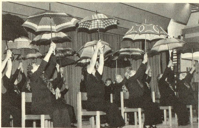
... eine andere produziert sich mit einer Schirm- übung.