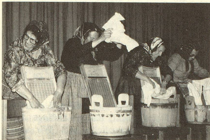
Eine Gruppe wäscht im Takt...