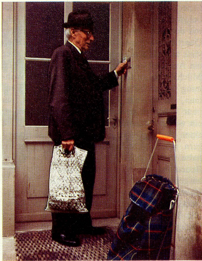
Der frühere Briefträger findet sich in seinem Quartier mühelos zurecht.