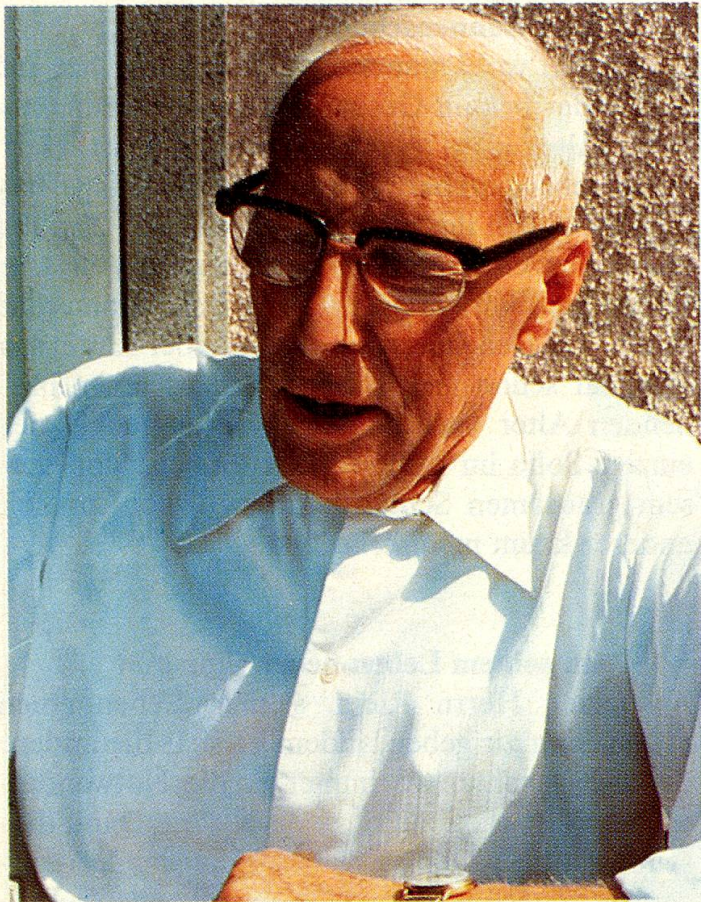
Gerne erzählt der rüstige Senior «Müsterli» aus seinem Leben.