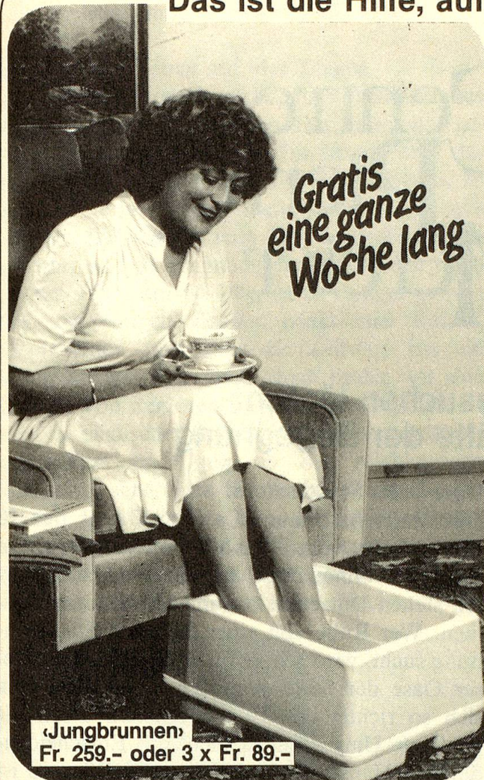
«Jungbrunnen» Fr. 259.- oder 3 x Fr. 89.-