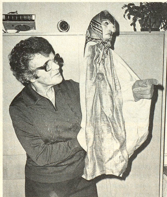
Die Lebendigkeit dieser Stabpuppe wird dadurch erhöht, dass die Hand des Spielers in einem Handschuh mitspielen kann.