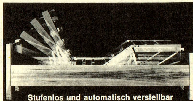
Stufenlos und automatisch verstellbar

Vertrauen Sie der Natur und ihren wirksamen Heilkräften!