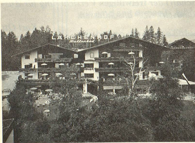
Unser Hotel Restaurant Lärchenhof, Seefeld

Das mit Schönheiten gesegnete Ländle Tirol lädt uns alle ein, eine harmonisch gestaltete, romantische Ferienwoche zu verbringen. Unser Programm, zusammengestellt für unternehmungslustige, gutgelaunte Senioren, bringt Abwechslung, Unterhaltung und beschauliche Stunden ohne Hetze. Dazu haben wir ein ideales, familiär geführtes Hotel der 1. Kategorie in Seefeld ausgewählt, etwas erhöht gelegen, in prächtiger, ruhiger Lage im Grünen. In diesem Hause werden sich alle wohl fühlen, dafür können wir bürgen. Unsere Reiseroute führt durch abwechslungsreiche, reizvolle Gebiete. Als Höhepunkte dieser Reise sind die Schlösser Neuschwanstein und Linderhof, die Krimmler Wasserfälle, das Zillertal und das Oetztal besonders zu erwähnen. Für perfekte Organisation und vorzügliche Reiseleitung garantiert Geri Berz persönlich. Wir freuen uns auf Ihre Anmeldung. GERI BERZ REISEN AG