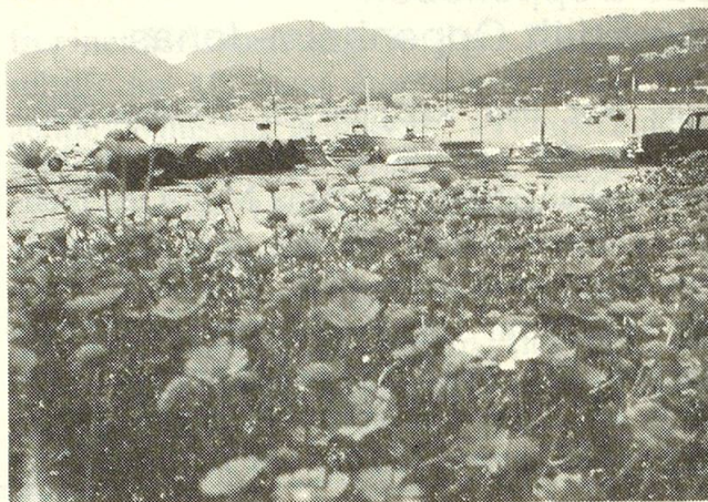
Hier das Programm

In Illetas, 8 km vom Zentrum Palmas entfernt, liegt unser Hotel «Bon Sol» – ein 4-Sterne-Hotel im altspanischen Stil mit herrlichem Blick auf die Bucht von Palma. Gut ausgestattete Zimmer mit Bad/WC, Telefon, Balkon, Heizung, Meerblick. Schöne Aufenthaltsräume mit viel Atmosphäre. Gemütlicher Speisesaal, Frühstücksbuffet, Menüwahl bei Mittag- oder Abendessen. Schöner Park, geheizter Swimmingpool, Wintergarten, Minigolf, Tischtennis, Sauna.