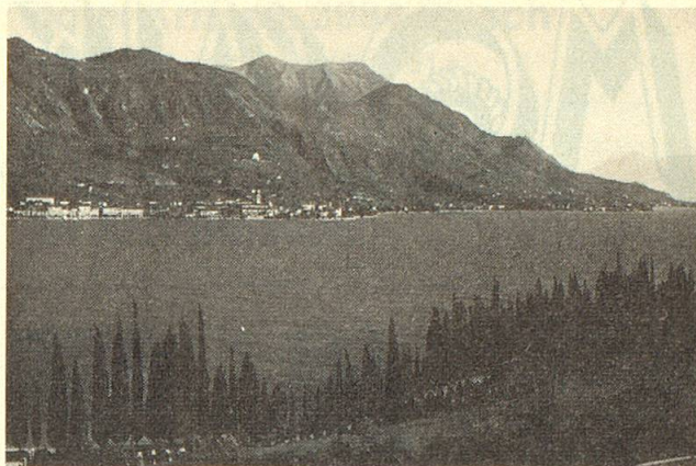
Der zauberhafte Gardasee