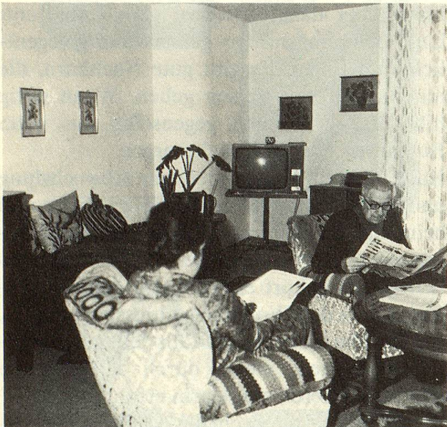
Eines der geräumigen Wohnzimmer.

Oft gehören die baulichen Aspekte zum Unerbaulichen. Nicht so in Unterentfelden. Der Baukredit von drei Millionen Franken wurde um fast zehn Prozent unterschritten. Trotz Erstellung im subventionierten Wohnungsbau konnte eine gute Bauqualität mit grosszügigen Grundrissen erreicht werden.