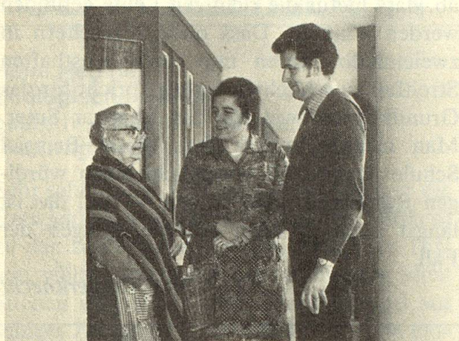
Das Betreuerehepaar Suter im Gespräch mit einer Pensionärin.

Praktisch funktioniert das so, dass bei vorübergehender Erkrankung die Betreuer einspringen, natürlich in Verbindung mit Arzt und Gemeindeschwester und nur, wenn keine Angehörigen oder Freunde zur Verfügung stehen. Und damit die Krankheit nicht als Last empfunden wird, erfolgt die häusliche Pflege während zehn Tagen kostenlos, nachher wird eine bescheidene Entschädigung verrechnet. Die weitaus meisten Kranken konnten so in der gewohnten Umgebung wieder gesunden und waren dankbar, nicht abgeschoben zu werden.