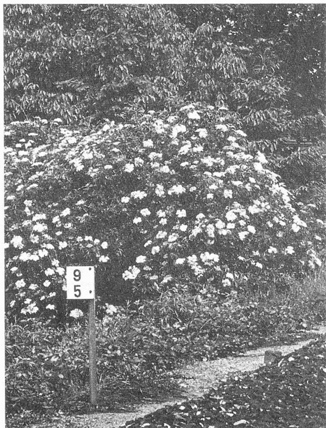
Holunderbäume stehen vielfach an Bahnlinien.

Unsere Vorfahren hielten sich an einem sonnigen Platz im Garten und die Bauern auf ihrer Hofstatt diesen Strauch mit den dunklen Beeren, von dem sie alle Bestandteile als Heilmittel brauchten: Blüten, Früchte und Rinde. Schon vor Jahrhunderten wussten die Leute um die Heilwirkung des Holundersaftes, und die heutigen Biochemiker haben diese untersucht und festgestellt, dass die Pflanze tatsächlich eine ungewöhnliche Vielfalt von Vitaminen, ätherischen Ölen und anderen organischen Stoffen enthält. Der Holundersaft aus frischen, vollreifen Beeren wird bei fieberhaften Erkältungen verwendet, soll aber auch schmerzstillende Wirkung haben. Dass ihn die vornehmen Damen früher als gesundes und natürliches Mittel gegen Fettleibigkeit priesen, sei nur als Kuriosität erwähnt, heute ist es sicherer, einfach weniger zu essen.