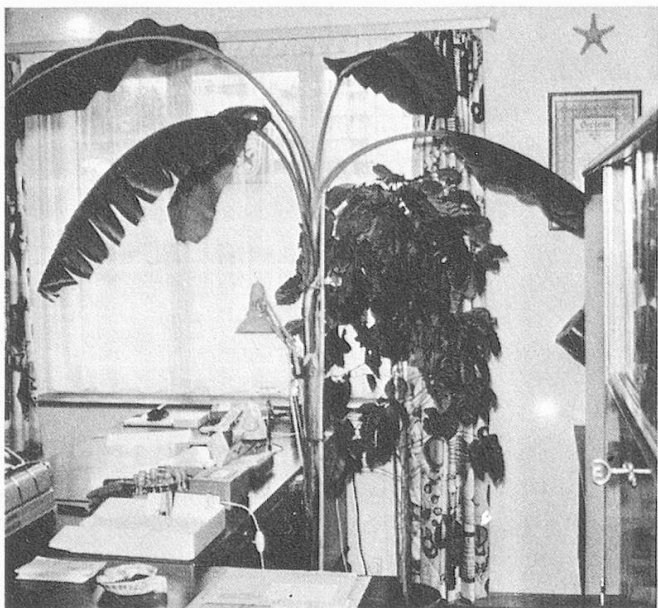
Bananenbaum vor dem Ansetzen der Blüte.

Es sind etwa drei Jahre her, als ich nach einem Besuch in Kenya eine kleine, vielleicht 30 cm hohe Pflanze in einem auf der einen Seite geschlossenen Kartonrohr mit nach Hause brachte. Beim Zoll musste die Pflanze gezeigt und dann zur Desinfektion in eine Gaskammer gebracht werden, damit allfällige Schädlinge und Krankheitskeime vernichtet werden könnten.