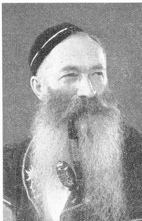
Armailli de la Gruyère