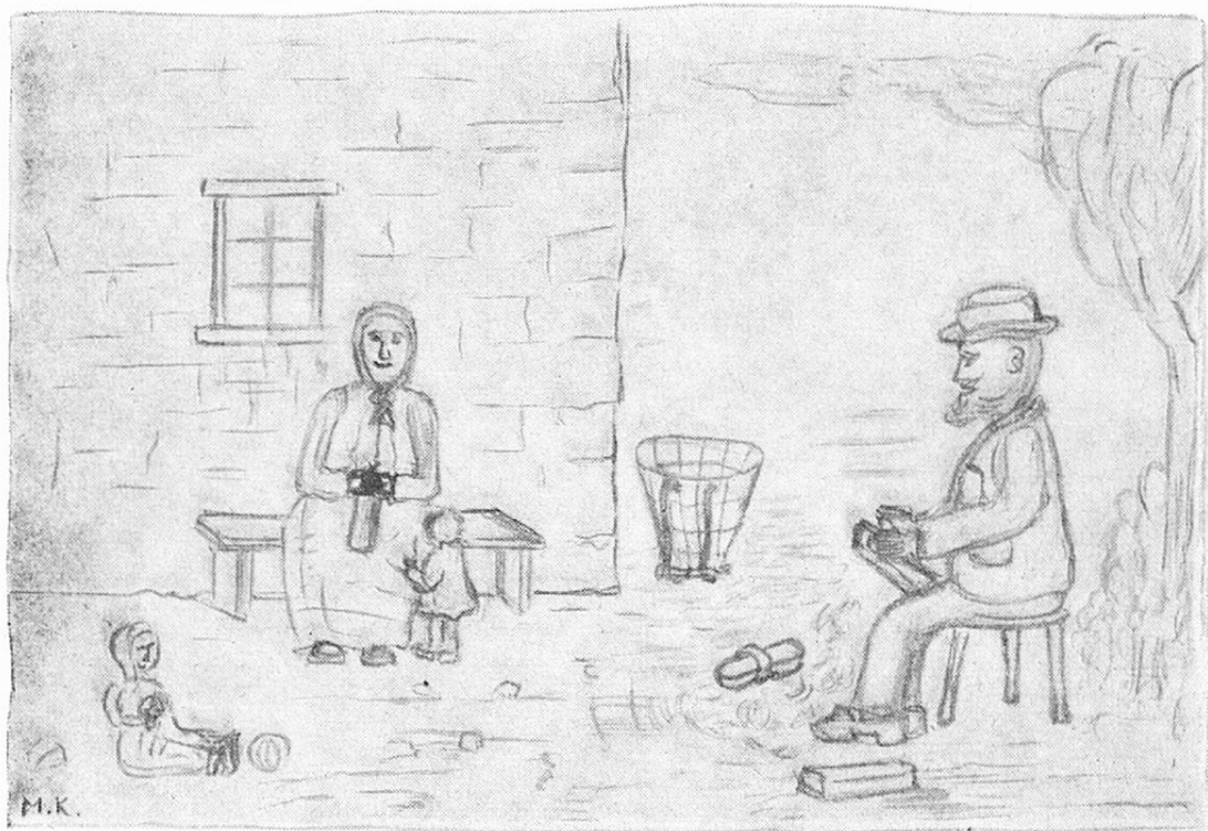
Nonno e nonna nel seno della famiglia

figli in America. Sorride quando parla di loro, perchè li sa bene e felici, ma il suo cuore è triste. Può morire oggi .... domani, ed i figli son così lontani. Lavora, lavora sempre per non sentire troppo il suo stanco cuore dolorante, e prega.