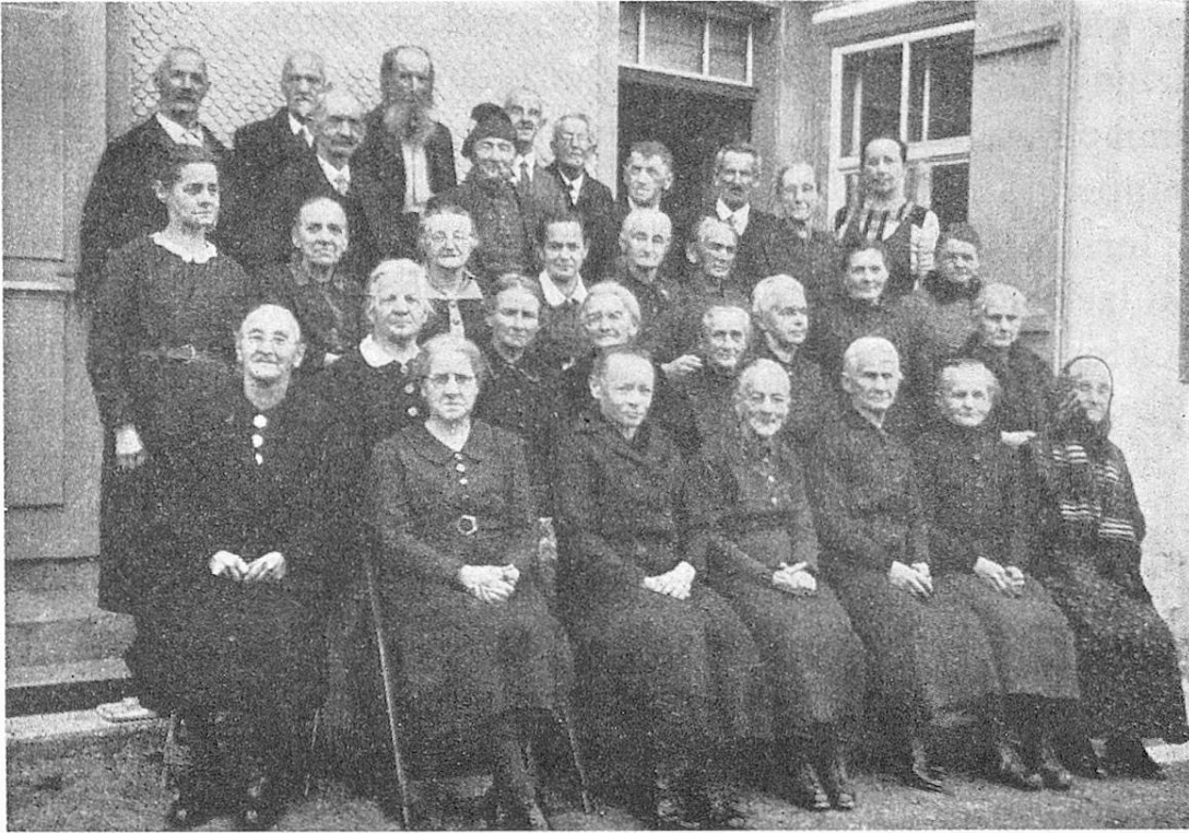
Altersweihnachtswoche 1943 Sonneblick

Alle Tage ist ja nun nicht Weihnacht während dieser Ferienwoche, aber jeder neue Tag bringt eine neue Überraschung. Einmal kommt der Ortspfarrer mit einer Gruppe „Junger Kirche“, die ein kleines Festspiel aufführt, dann werden Lichtbilder gezeigt, ein anderes Mal erzählt eine Missionarin von ihren Erlebnissen in Indien. Es wird viel gesungen, bis die Gäste selbst die letzte Scheu verlieren und mit einstimmen. Da und dort in einer Ecke wird ein altes, fast vergessenes Lied leise probiert und geübt und schließlich mit zitternden Stimmen, aber mit unendlicher Freude durch alle Strophen hindurch zu Ende gesungen. Ein paar Männer wagen es sogar mit einem „Zäuerli“ (Jodel), ein altes Mütterchen rezitiert ein Gedicht, das es noch von der Schule her in Erinnerung hat und wird ganz rot vor innerer Genugtuung ob all dem Lob, das ihr deswegen zuteil wird. Einfache Gesellschaftsspiele werden inszeniert; wie herzlich lachen alle ob der eigenen und der andern Unbeholfenheit! „Ich glaubte, seit dem Tode meines Mannes nie mehr fröhlich sein zu können, und nun