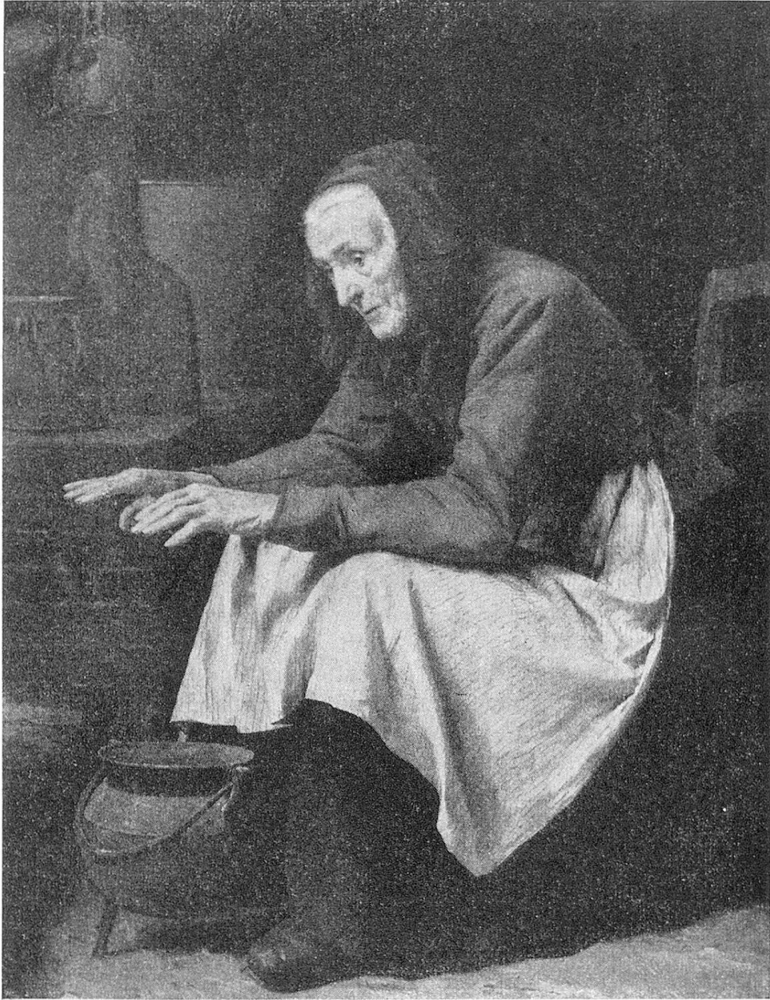
A. Anker, Hohes Alter.

Augen unserer Alten im beglückenden Strahl goldener Abendsonne aufleuchten läßt. Und weil die Stiftung „Für das Alter“ ihre Aufgabe in diesem Sinne auffaßt und erfüllt, wird auch die Kraft dankbarer, segnender Hände fürderhin über ihrem Wirken walten.