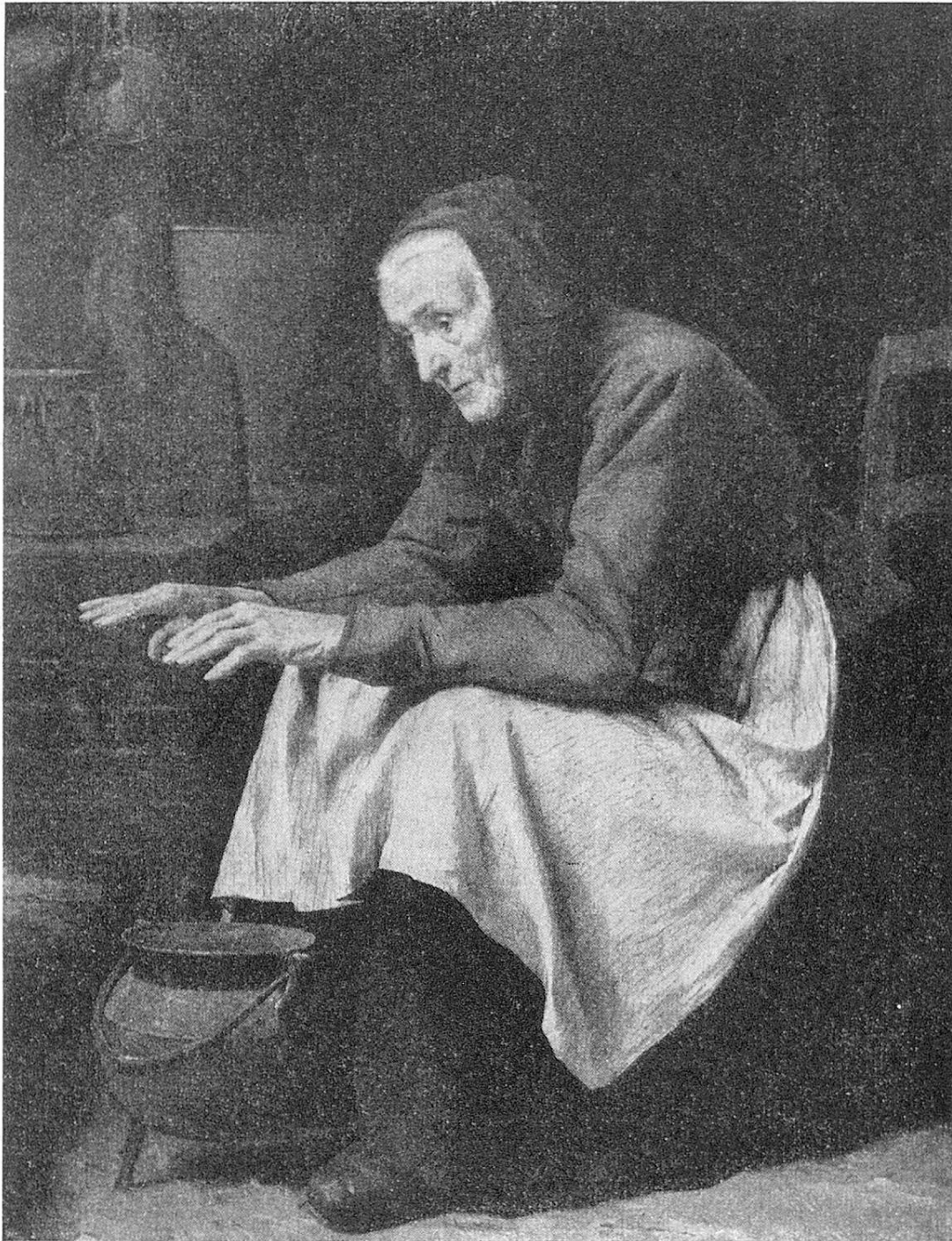
A. Anker, Hohes Alter.

Augen unserer Alten im beglückenden Strahl goldener Abendsonne aufleuchten läßt. Und weil die Stiftung „Für das Alter“ ihre Aufgabe in diesem Sinne auffaßt und erfüllt, wird auch die Kraft dankbarer, segnender Hände fürderhin über ihrem Wirken walten.