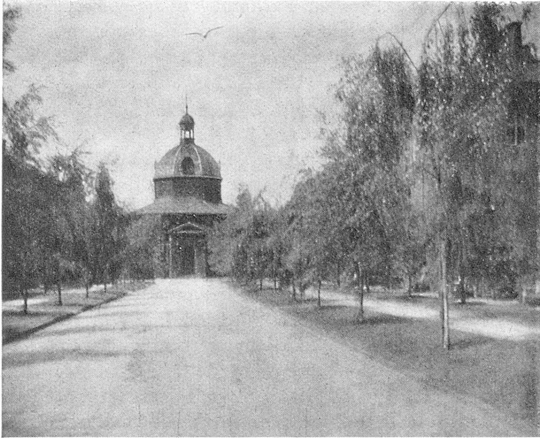
Die Kirche der Altersstadt.

testen Sehenswürdigkeiten der Stadt gezeigt wird. Das Erstellungskapital betrug ca. 6 Millionen dän. Kronen (100 Kr. = 103.60 Schweizerfranken), die Betriebsausgaben belaufen sich nach den zuletzt zugänglichen Statistiken auf etwa 2,5 Mill. Kr., die Ausgabe pro Verpflegungstag auf etwa 4.50 Kr.