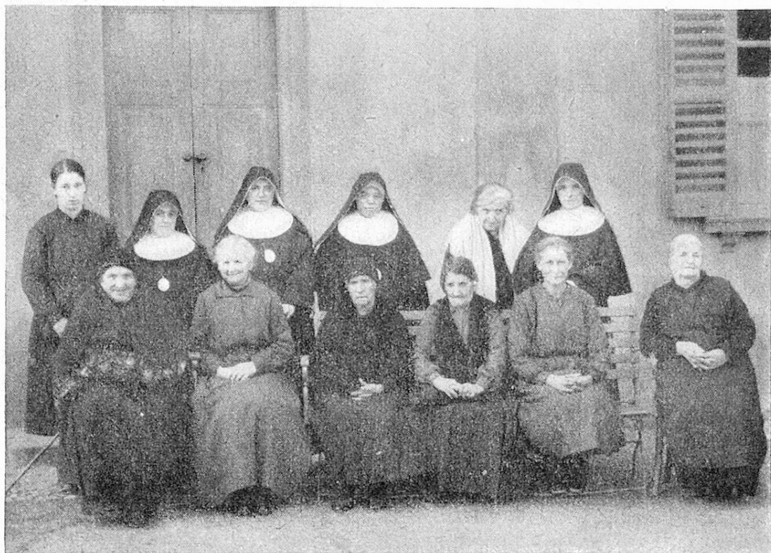
Vecchie donne ricoverate e suore del Ricovero S. Rocco.

Intanto la suora era andata anche a Roma a trattare coi Superiori dell'Ordine. Roma mandò un delegato ad esaminare la cosa, il quale ne sembrò entusiasta. Tutto dunque sembrava procedere a gonfie vele, quando ad un tratto dall'Italia, dal monastero della suora e da altri monasteri del medesimo Ordine cominciarono ad arrivare ripulse sopra ripulse. La povera suora restò come annientata. Che fare pertanto del denaro raccolto? La suora non esitò un istante. Mise a disposizione del Ricovero erigendo la somma raccolta e ritornò in Italia, a rinchiudersi di bel nuovo tra le mura del suo monastero. Povera suora! come è degna di essere ricordata!