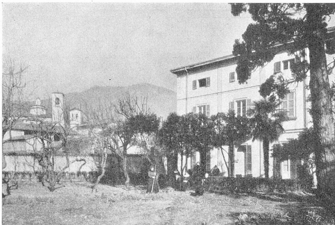
Il Ricovero S. Rocco visto dal giardino.

Nel mese di ottobre dell'anno 1935 si faceva una fondazione: la casa Catenazzi veniva acquistata, e il Ricovero aperto.