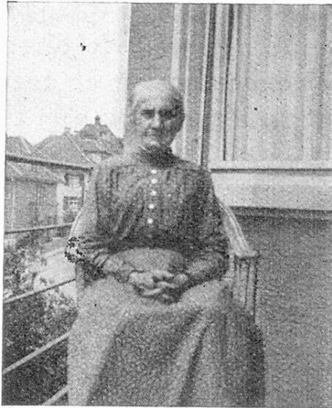
In 65jährigen treuen Diensten bei der gleichen Meisterin und Freundin in Ehren alt geworden.

das Bild wäre unvollständig, wenn ich nicht auch des Sonntags gedenken würde. Das waren dann erst die Sonnentage. War am Morgen das Vieh besorgt, dann rüsteten sich die beiden zum Kirchgang, und selten nur fehlten sie im Gottesdienst. Am Nachmittag aber war richtiger Ruhetag. Der alte Hitti hat am Sonntag kein Heu eingetan,