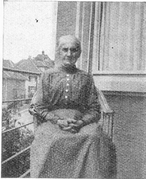
In 65jährigen treuen Diensten bei der gleichen Meisterin und Freundin in Ehren alt geworden.