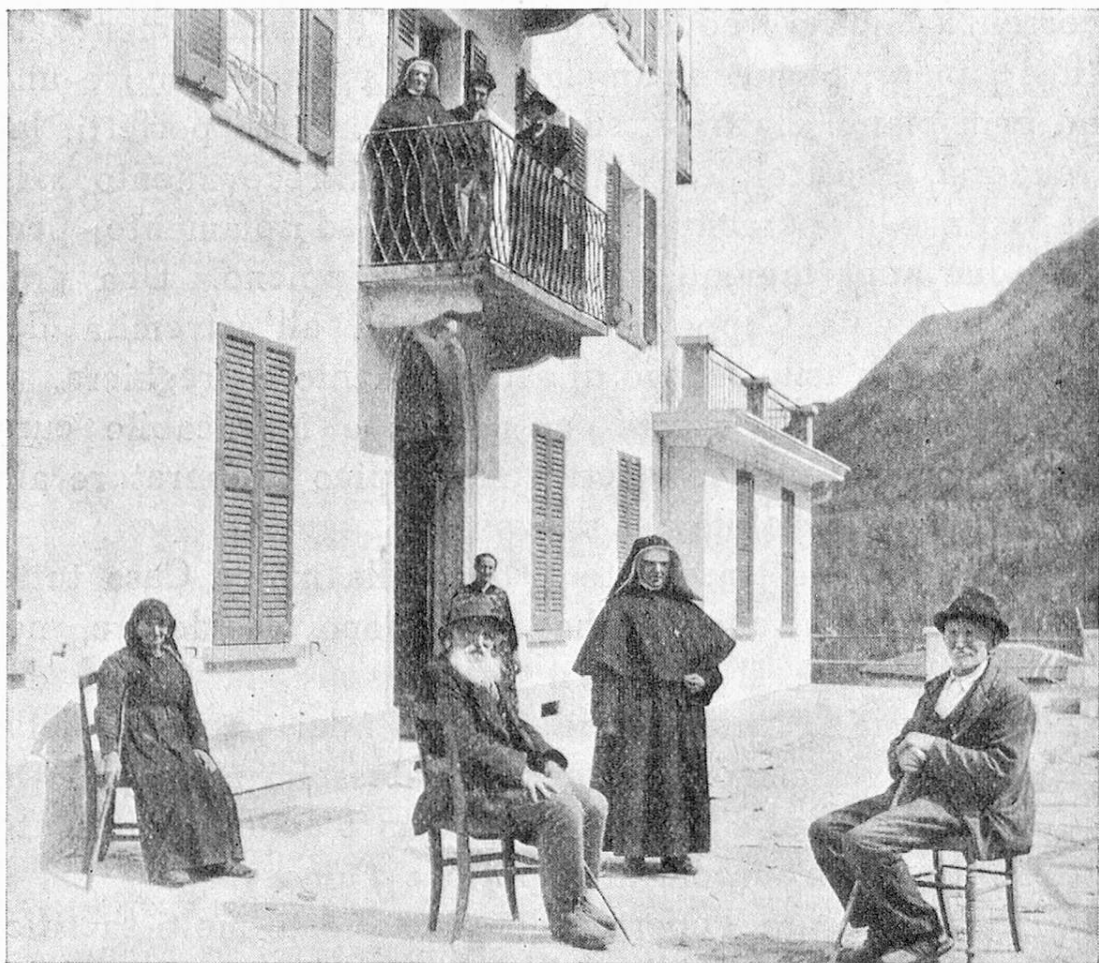
I vecchi dell' asilo-ricovero al sole.

impresa Mellini di Cavigliano, sui disegni dell' esimio architetto Eugenio Cavadini di Locarno. E questi genialmente ha risoluto il problema della congiunzione dei vecchi edifizii, innalzandoli a tre piani e prolungandoli a mezzodì, di una costruzione a terrazza, disimpegnata, perché possa servire anche d'asilo ai bambini. Ne è riuscito un palazzo dalle linee semplici, ma imponenti, la cui massa si distingue lontano, appena fuori Locarno, e caratterizza Intragna, intonandosi perfettamente alle case e soprattutto alla mole del suo bel campanile. Poggia a sud ovest sullo spalto ove sorge il paese e si orienta nella facciata ampia verso le terre di Pedemonte. È fiancheggiato da un piazzale doppio e circondato da fondi e vigneti che degradano a valle e puntano verso la stazione della ferrovia.