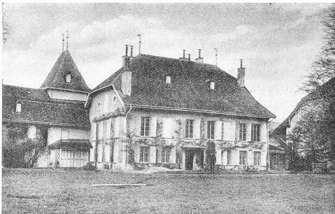
Asile des vieillards du Gros de Vaud à Goumoëns-la-Ville.

temps bien clair, apercevoir le sommet du Pilate, et plus loin encore le Sentis.