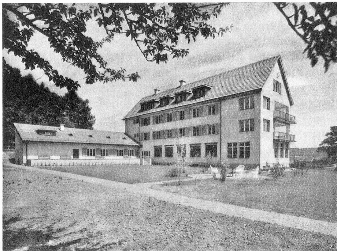
Emilienheim für alte Blinde in Kilchberg b. Zürich: Gesamtansicht. Foyer pour vieillards aveugles à Kilchberg p. Zurich: vue générale.

Un certain nombre de vieillards aveugles sont hospitalisés actuellement dans des asiles pour voyants, mais les conditions de leur vie seraient meilleures dans une maison qui leur serait destinée. Le contact journalier de leurs compagnons d'infortune, mieux à même que quiconque de comprendre leur mentalité leur est moralement plus utile que celui des voyants, même animés des intentions les meilleurs. Du reste, la plupart des asiles pour voyants admettent difficilement les aveugles.