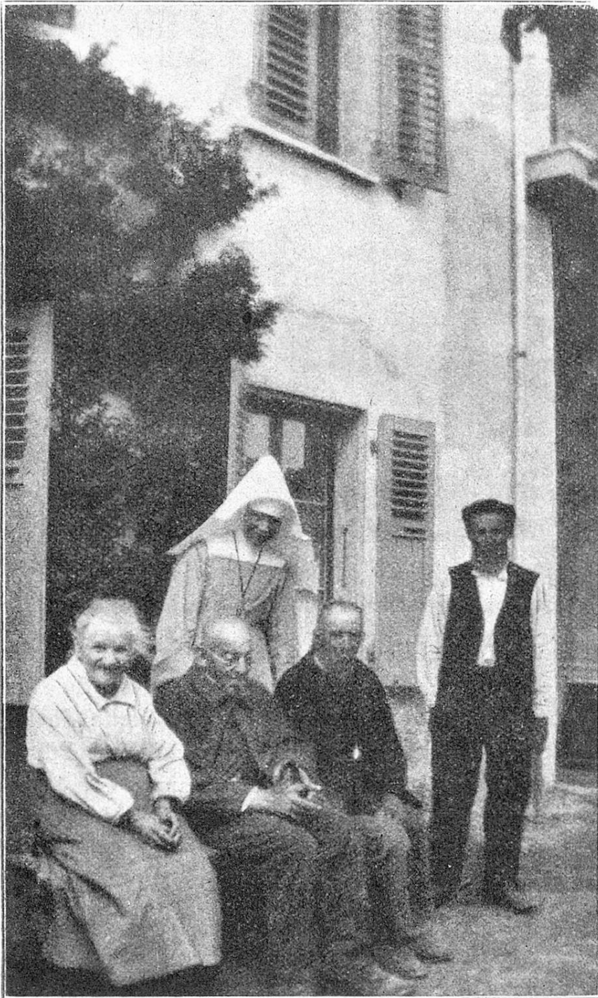
Pensionnaires et sœur de l'Asile St. François à Sion. Insassen und Schwester des Altersheims St. Franziscus in Sitten.

allocution fut prononcée par le R. P. Paul-Marie, l'initiateur et le réalisateur dévoué de l'œuvre qui a su trouver les collaborateurs et les moyens financiers nécessaires. Des représentants de l'Etat, de l'Evêque et de la Municipalité prirent successivement la parole pour exalter l'utilité et la grandeur sociale de l'asile et le dévouement de son directeur et des dames et messieurs qui l'ont secondé.