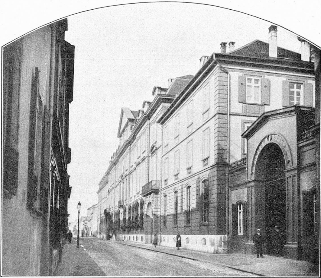
Straßenfassade des Markgräfischen Hofes. Façade du Markgräflischer Hof.

geldgarantie ihm Empfohlenen aufzunehmen, soweit der vorhandene Platz reiche, und so sind z. Z. gegen 150 Niedergelassene in der Pfrundanstalt untergebracht. Das zu zahlende Kostgeld ist auf Fr. 3.— pro Tag festgesetzt. Die Versorgungskommission bringt dasselbe zusammen aus Beiträgen der Heimatgemeinden, ferner soweit möglich auch von Angehörigen und Arbeitgebern und endlich aus dem Zuschuß des Staates. In der Mehrzahl der Fälle hat der letztere \frac{2}{3} — \frac{3}{4} des Ganzen zu übernehmen. Das Bürgerspital seinerseits leistet die Unterbringung (was für 150 Personen schon ins Gewicht fällt) und außerdem an Bar, was für den Anstaltsbetrieb durch das erhaltene Kostgeld nicht gedeckt ist, d. h. pro Jahr Fr. 60—75,000. Eine solche Aufwendung aus Bürgermitteln für Nichtbürger ist jedenfalls ein Unikum in der Schweiz.