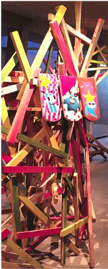
Leto's farbige Ziegelwelt im Ziegelei-Museum.