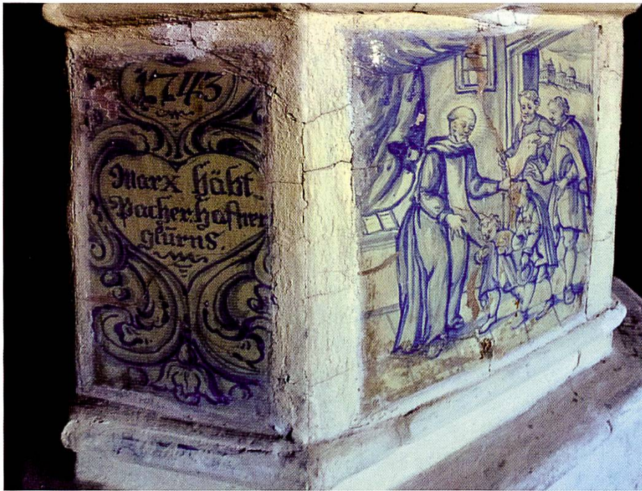
Abb. 2: Teilansicht des 1743 vom Hafner Markus Hapacher angefertigten Ofens im Kloster Marienberg.

Wiederaufbauarbeiten konnten etwa 500 Dachziegel abgedeckt und für die Deckung der Pfarrkirche weiterverwendet werden. 13 Etwas später ist wieder ein Hafner ( figulus ) in Glurns selbst nachweisbar: Markus Hapacher. 14 Derselbe hat 1743 im nahegelegenen Benediktinerkloster Marienberg einen Ofen zum Teil mit blau-weiss glasierten Kacheln erbaut und als Marx Häbtpacher signiert (Abb. 2). 15