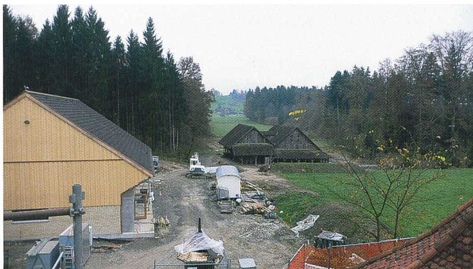
Cham, Zieglerareal: links Neubau, im Hintergrund die alte Ziegelhütte, Blick gegen Süden, am 14. November 2012.

Maschinensammlung in der Ziegelei Paradies in Schlatt durchgeführt. Wir erhielten Besuche von grösseren Gruppen, unter anderen der Schweizerischen Gesellschaft für Technikgeschichte SGTI zusammen mit dem Schweizerischen Eisenbahn-Amateur-Klub Zürich SEAK sowie des Jahrgangs 1944 von Steinhausen. Ausserdem wurde die romantisch gelegene Ziegelhütte auch für Apéros, einen Grillabend und für ein Fotoshooting gebucht.