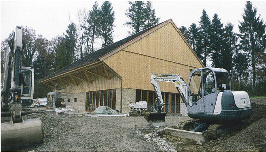
Cham, Zieglerareal: Museumsneubau während des Innenausbau und der Umgebungsarbeiten, Blick gegen Norden (14.11.2012).