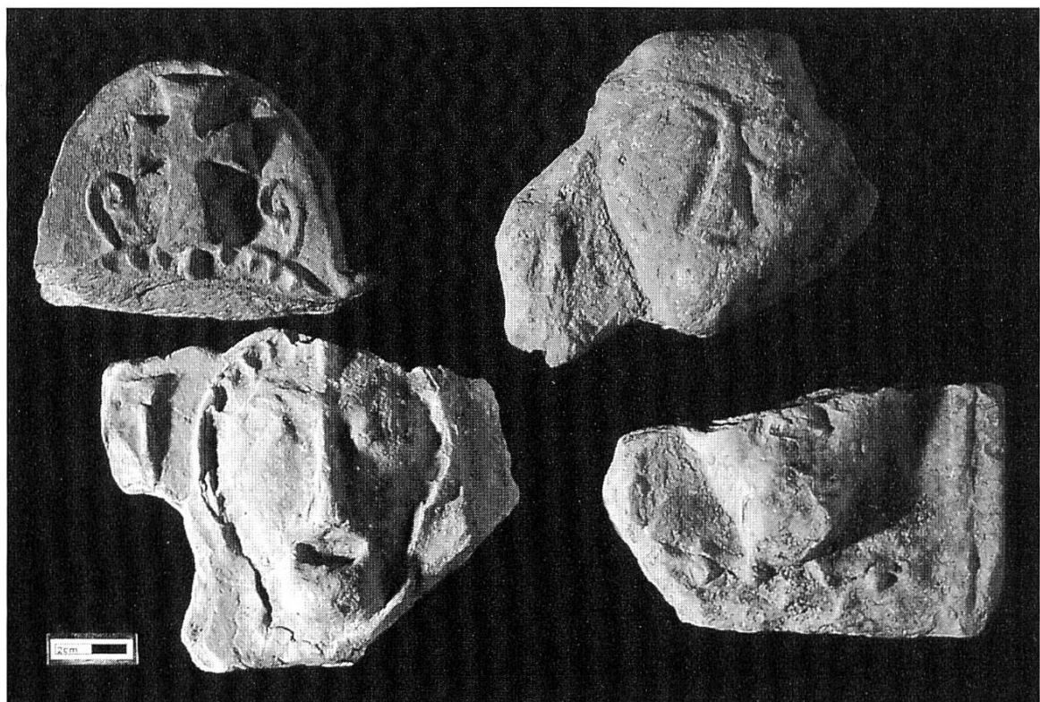
Antefix und Fragmente von Antefixen von Saint- Denis.