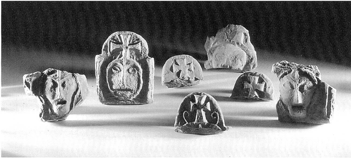
Fig. 3 Typologie des antéfixes découvertes à Saint- Denis.