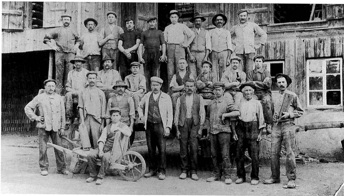
Abb. 3 Belegschaft der Ziegelei Brandenberg in Zug, um 1920.