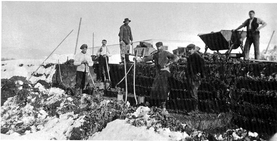
Abb. 4 Lehmgrube der Ziegelei Brandenberg: manueller Abbau 1918.