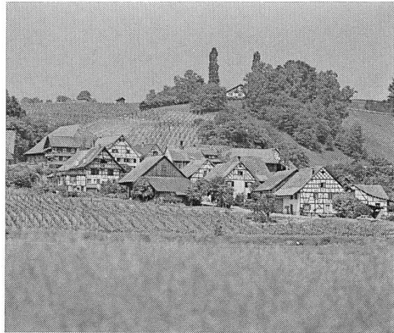
Dach- landschaft in Rüdlingen