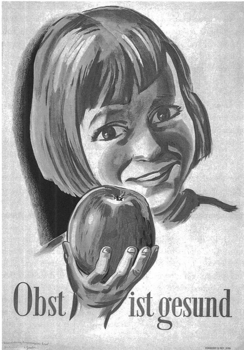
Plakat «Obst ist gesund», [um 1943]. Plakat Grieder, Kümmerly & Frey, Bern.