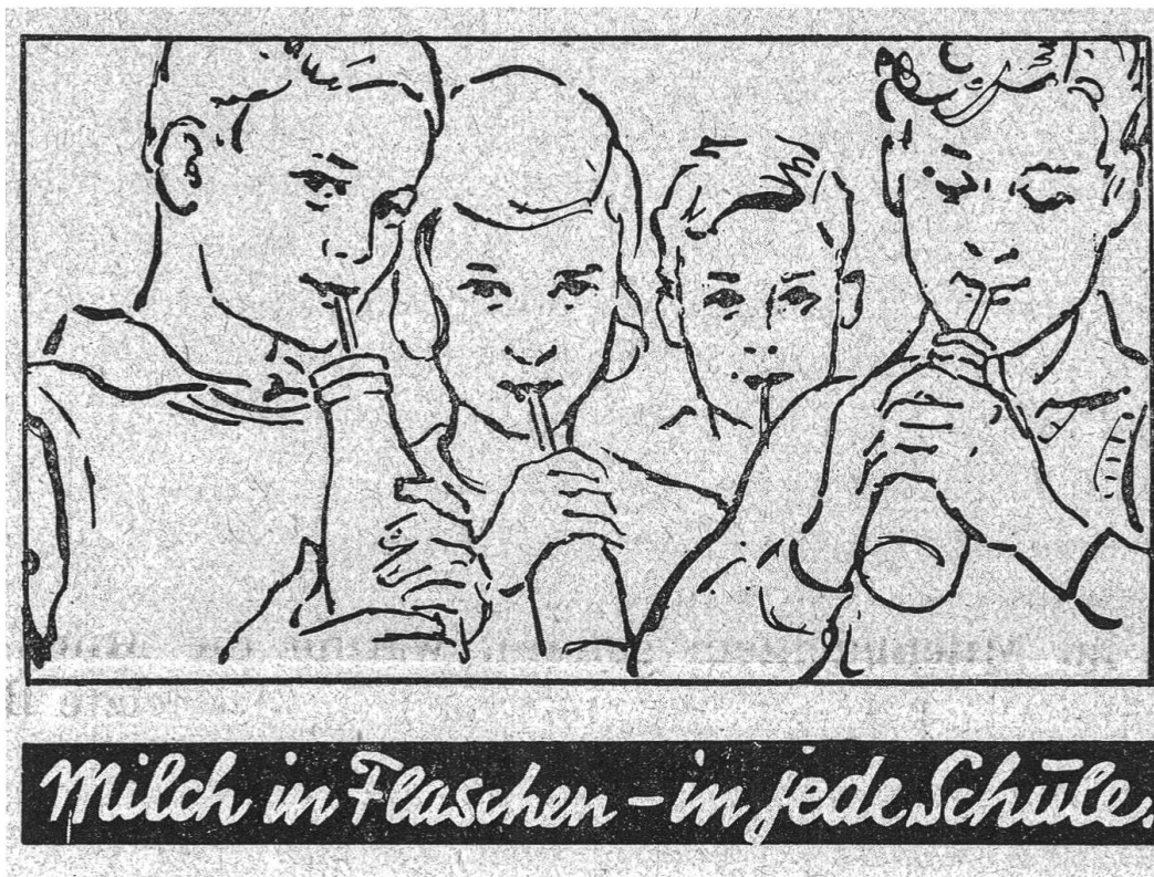
Werbekbild «Milch in Flaschen – in jede Schule».