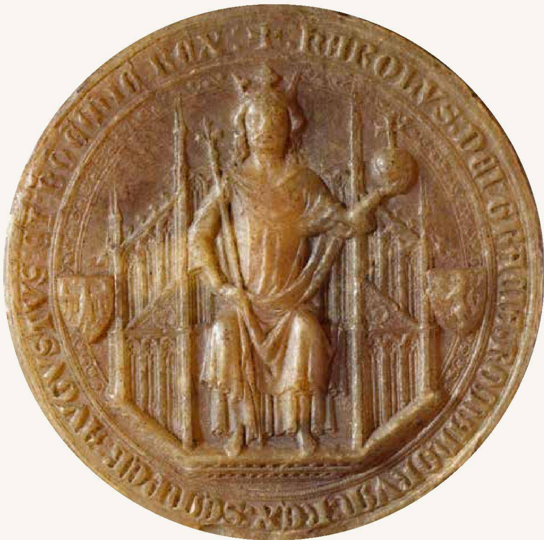
Im Zeichen königlicher Autorität: Siegel von Karl IV., der 1348 Ulrich von Bubenberg jene Reichslehen verlieh, die bisher Johann von Strättligen innehatte. – Staatsarchiv des Kantons Bern, Fach Freiheiten, Siegel der Urkunde vom 16.1.1348.