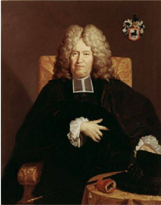
Abb. 5 Der spätere Schultheiss Johann Friedrich Willading (1641–1718) sah in der geplanten Kolonie eine Möglichkeit zur endgültigen Wegweisung der Täufer. – Bürgerbibliothek Bern.