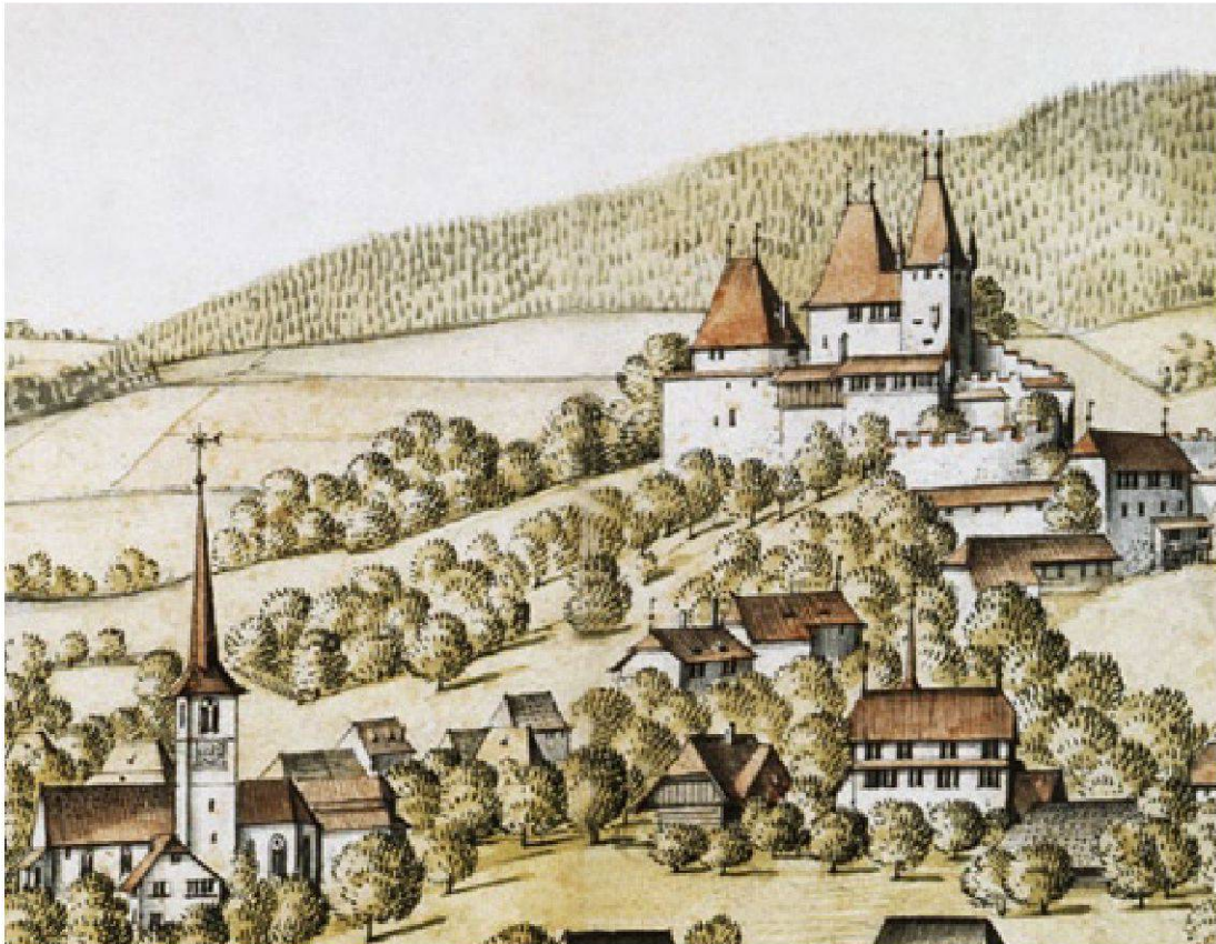
Abb. 2 Die Herrschaft Worb. Albrecht Kauw, 1669. – Historisches Museum Bern, Inv. Nr. 26091 [Ausschnitt].

(1674–1711) eine wichtige Rolle, der als Berater dafür sorgte, dass die neue Kolonie nicht in Pennsylvania, sondern in Carolina entstand.