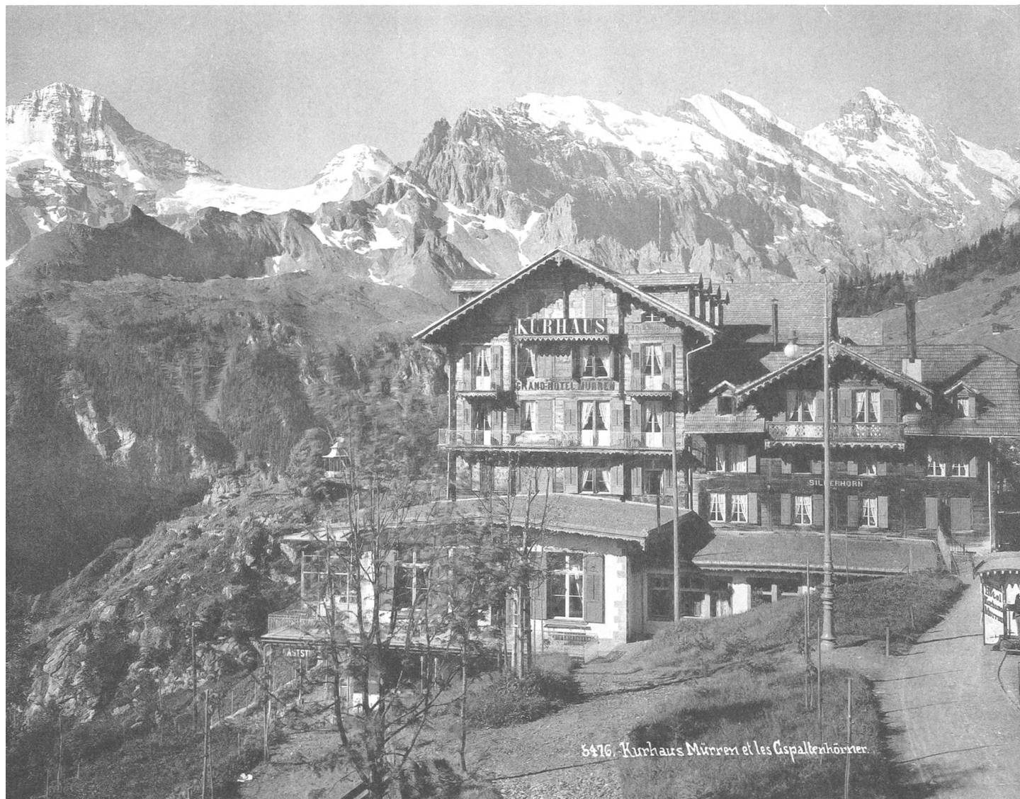
5476. Kurhaus Müren et les Gspaltenhörner.

Müren, Grand Hôtel Müren & Kurhaus. Ansicht der imposanten Hotelanlage um 1900. Das eigene Pferdetram holte die Hotelgäste seit 1894 am Bahnhof ab.