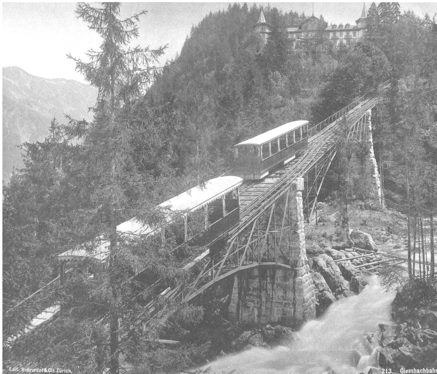
Brienz, Grandhotel Giessbach. Die Giessbachbahn verband als erste Hotelbahn der Schweiz seit 1879 die Schiffsstation mit der Hotelanlage. Foto um 1890 mit den beiden sich auf der automatischen Ausweiche kreuzenden Wagen. Im Hintergrund ist das nach dem Brand 1883 durch den Architekten Horace Edouard Davinet wieder aufgebaute Hotelgebäude sichtbar.