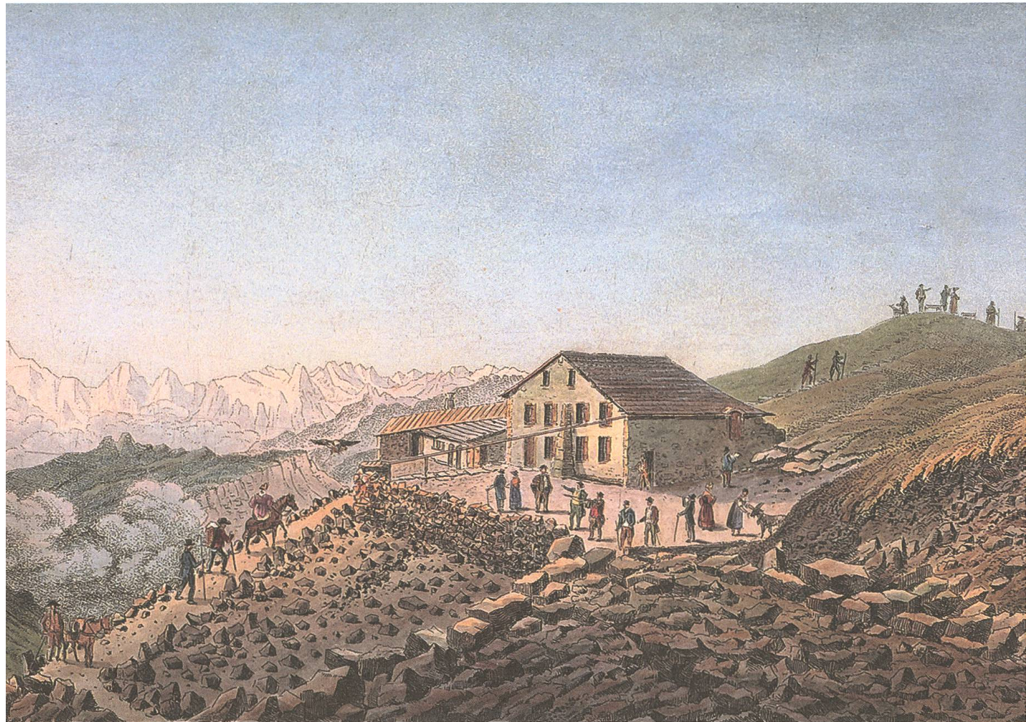
Grindelwald, Hotel Faulhorn. «Vue de l'auberge du Faulhorn la plus haute habitation de l'Europe élevé 8140 pieds». Kolorierte Aquatinta von Samuel Weibel. – Wehrli, Martin: Faulhorn. Unterseen 2003 , 20.