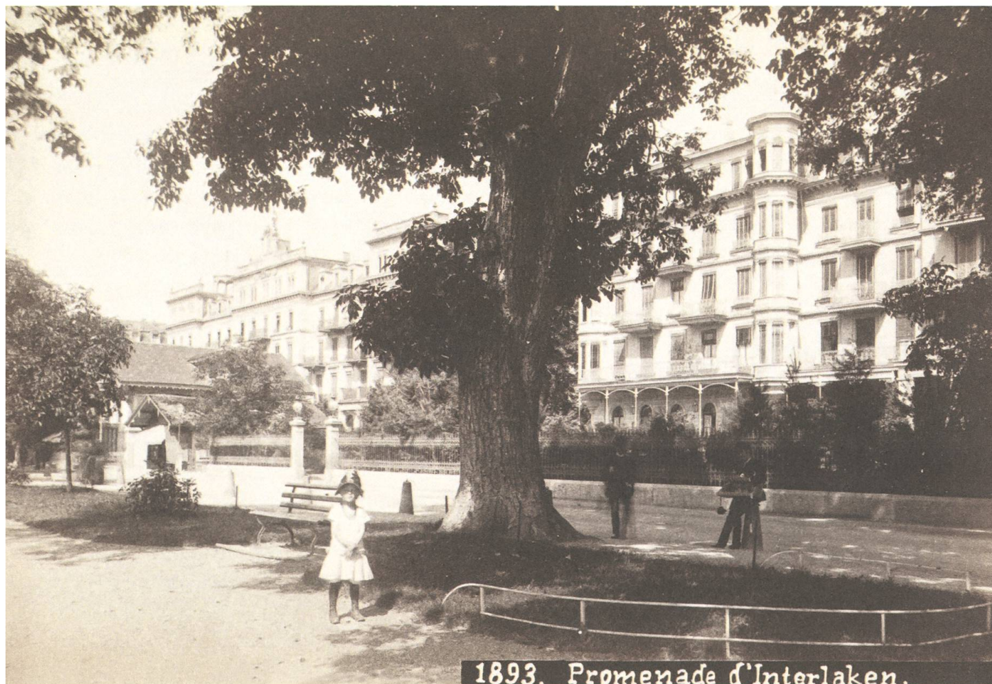
Interlaken, Höheweg mit den beiden 1865 eröffneten Hotels Victoria (links) und Jungfrau. Das Hotel Jungfrau weist bereits den 1883 erbauten Westflügel auf. Fotografie von Johann Adam Gabler um 1890. – ETH-Bildarchiv Ans 12351 .