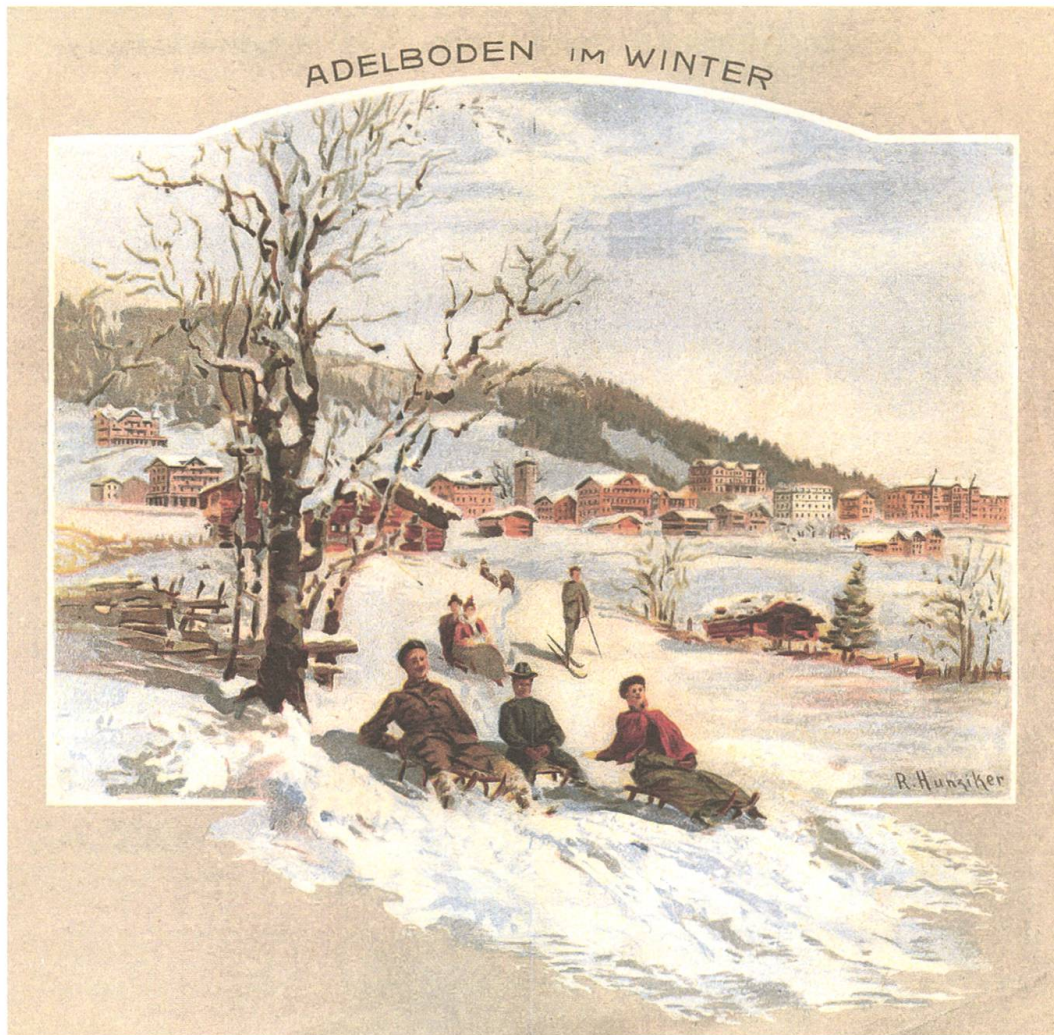
Adelboden im Winter. Mit der Eröffnung der ersten Wintersaison im Dezember 1901 gehörte Adelboden zu den Wintersportpionieren im Berner Oberland. Werbeprospekt für die erste Wintersaison.