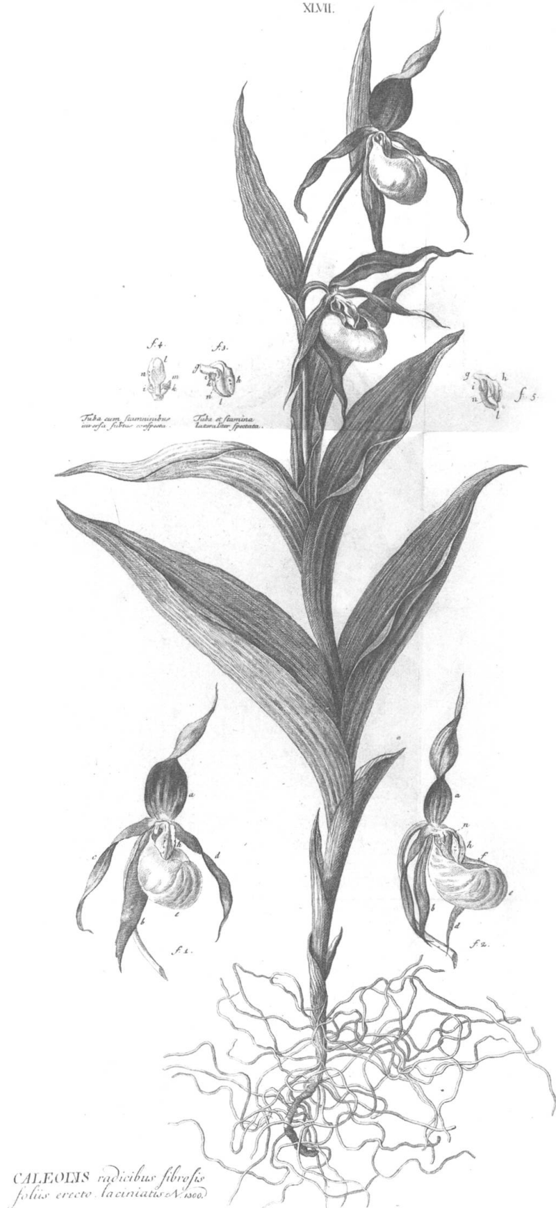
Cypripedium calceolus . Sabot de Vénus. – Haller, Albrecht von: Historia stirpium indigenarum Helvetiae inchoata . Bernae [Berne] 1768. Gravure de Johann Joseph Stöercklin. Universitätsbibliothek Bern, MUE Kp III 137.