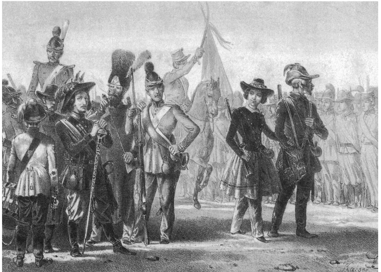
Franziska Anneke am Arm ihres Mannes Fritz, im Hintergrund Freischarentruppen. – Costüme aus dem pfälzischen Volksheer, gez. von F[riedrich] Kaiser, Lithografie 1849.