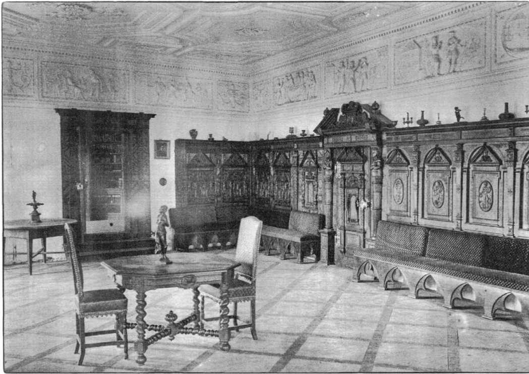
Festsaal, Blick nach Südwesten vor 1937. Täferausstattung in drei unterschiedlichen Ausformungen des 17. Jh. und ergänzt mit neugotischen Bänken, in dieser Form eine Assemblage des 19. Jh. – Denkmalpflege des Kantons Bern .