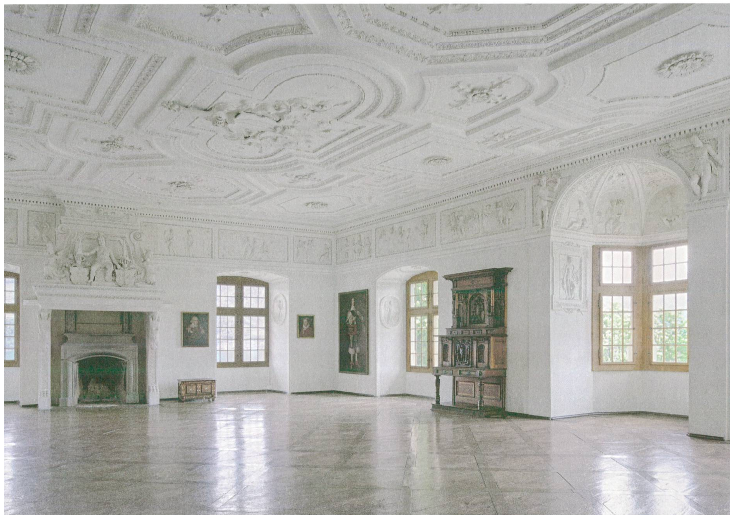
Gesamtaufnahme des Festsaals 1614 von Antonio Castelli. – Stiftung Schloss Spiez, Foto: Verena Menz.