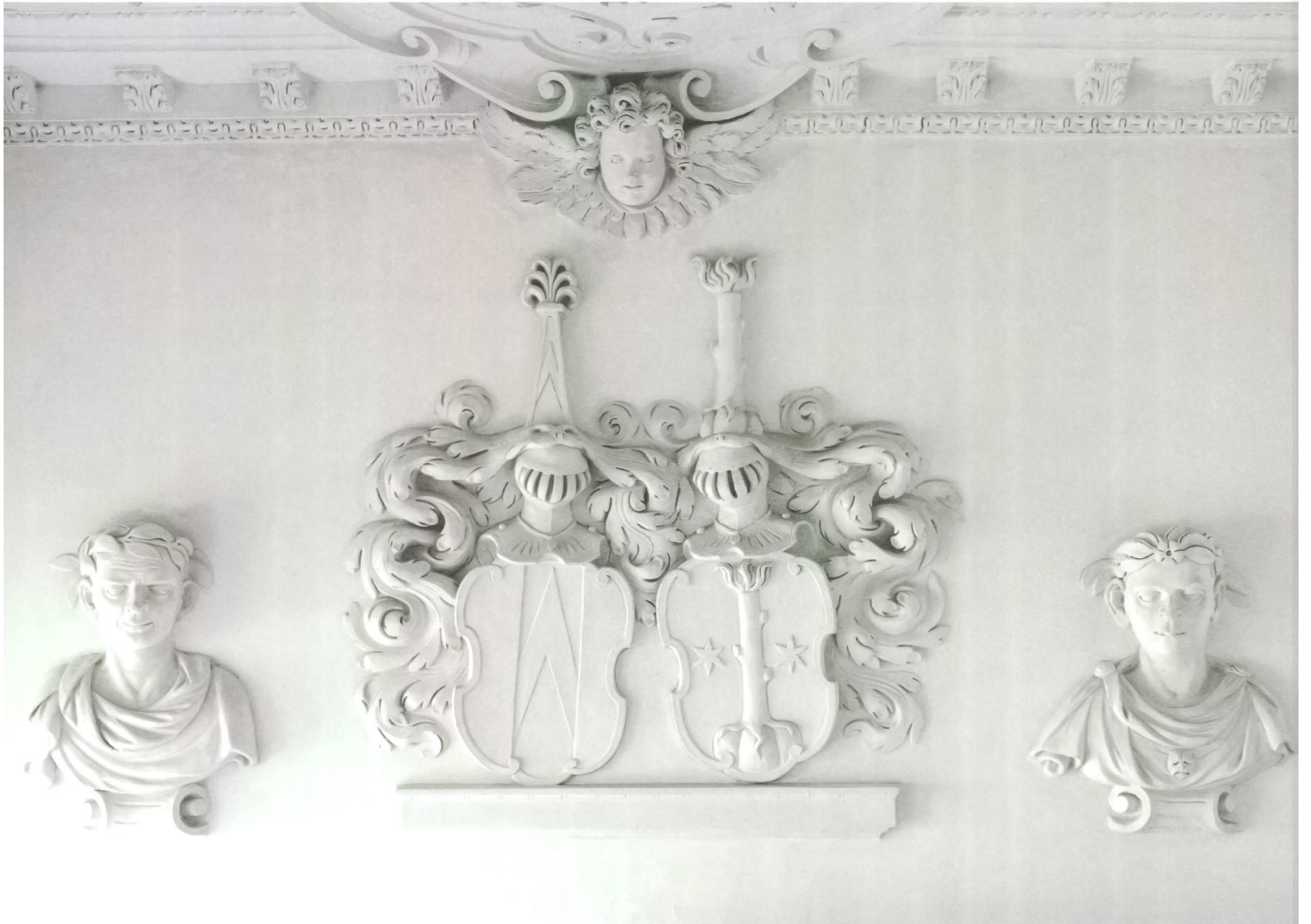
Schmalseitiger Abschluss des grossen Korridors, Wappenallianz von Erlach / von Graffenried, flankiert von antikischen Büsten. Stuckreliefs 1627 von Giovanni und Octaviano Brando.