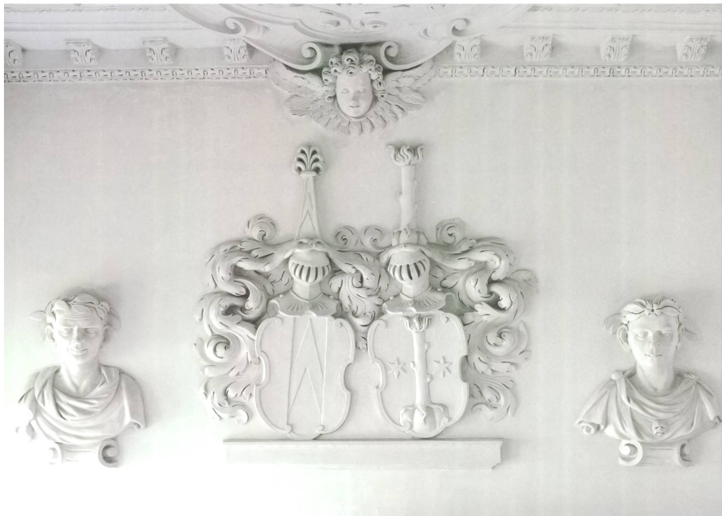
Schmalseitiger Abschluss des grossen Korridors, Wappenallianz von Erlach / von Graffenried, flankiert von antikischen Büsten. Stuckreliefs 1627 von Giovanni und Octaviano Brando.