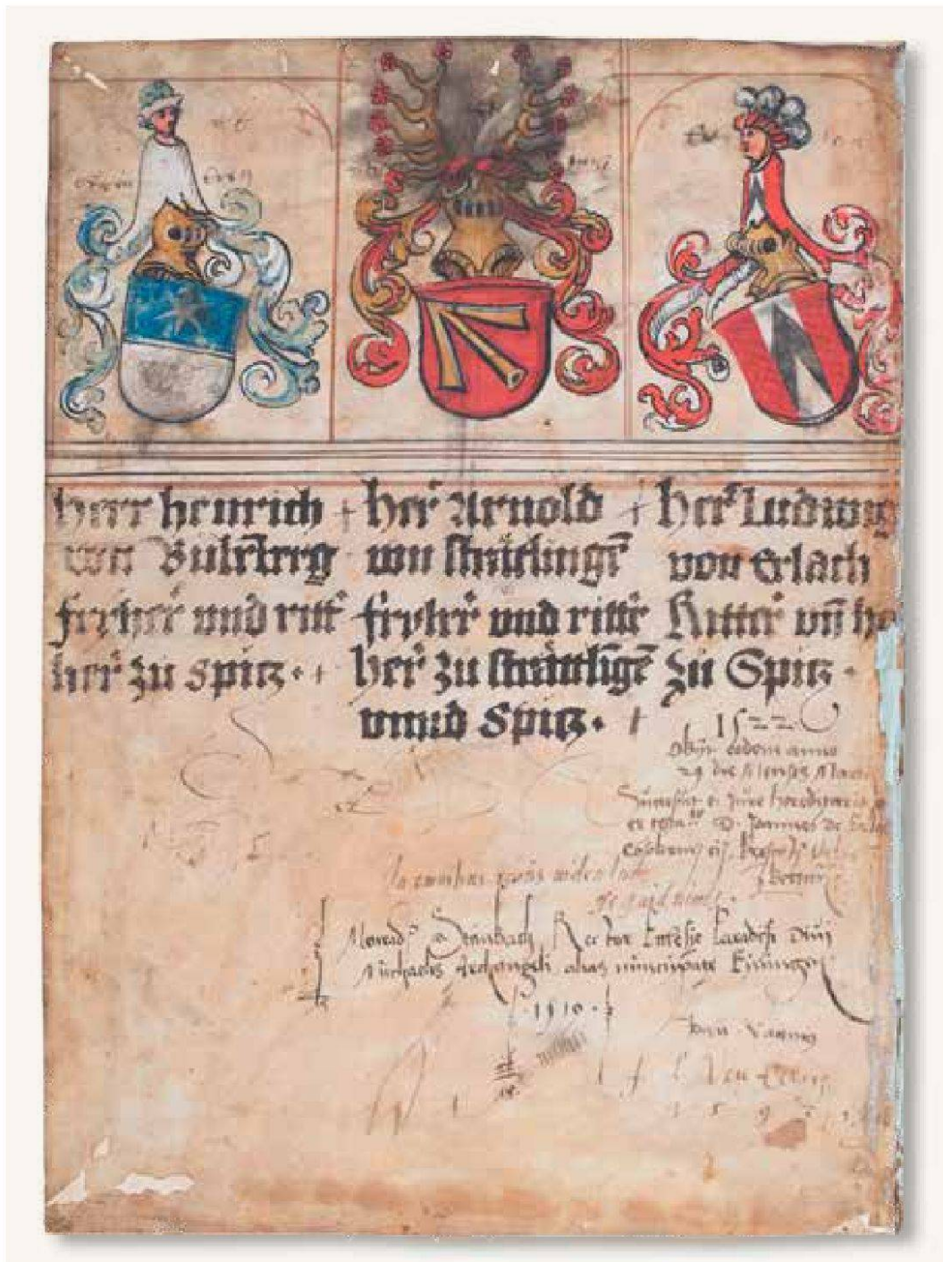
Titelseite der Strättlinger Chronik mit zahlreichen Benutzernamen. Die Schilde der Bubenbergr und von Erlach neigen sich dem Wappen des Gründervaters Arnold von Strättlingen zu. – Um 1519/22, Tinte auf Pergament. Staatsarchiv Bern, B III 40.