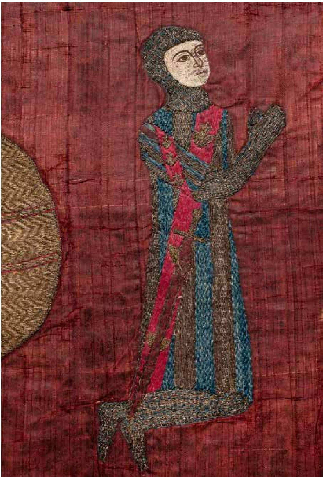
Antependium des Otto von Grandson (Zypern [?] und England, um 1290/1300). Gerüstet und mit umgürtetem Schwert kniet Otto von Grandson vor Maria (auf dem Bild nicht zu sehen). Seine Hände hält er im Betgestus erhoben. Der Waffenrock widerspiegelt das Familienwappen: Rote Querbalken mit Jakobs-muscheln (?) verlaufen diagonal über silberne und blaue Streifen (zum Antependium siehe auch Anm. 31). – Bernisches Historisches Museum [Ausschnitt] .