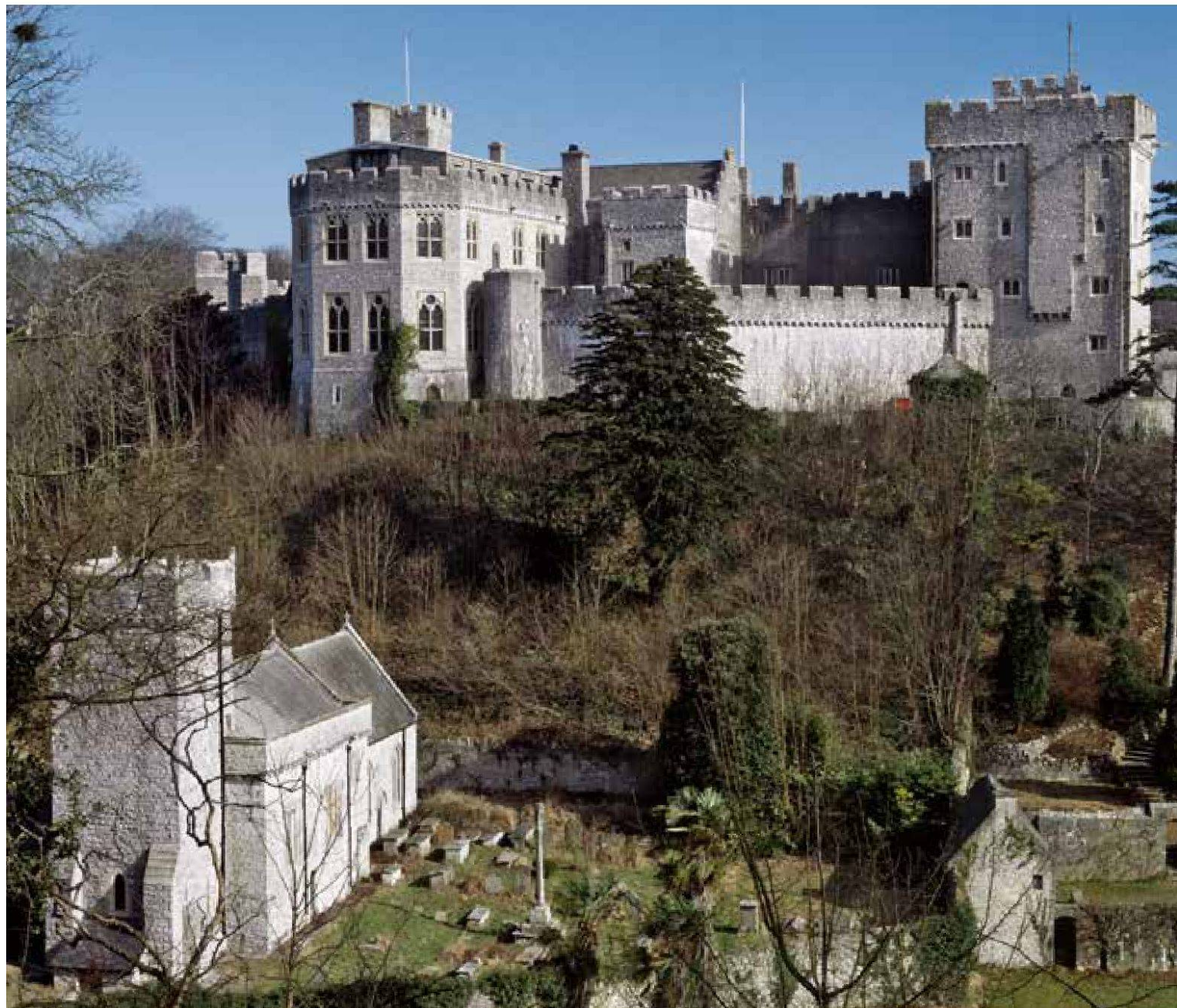
St. Donat's Castle mit Pfarrkirche, Vale of Glamorgan, Wales.