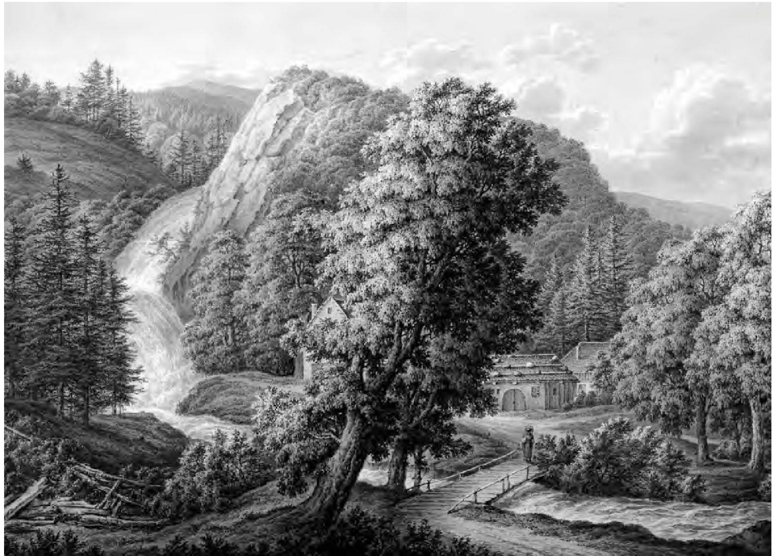
Péry (dt. Buderich) war eine der Ortschaften im Erguel, die Biel gerne an sich gezogen hätte, um einen eigenen Kanton zu bilden. Von Johann Joseph Hartmann (1752–1830). – Eigentum der Stadt Biel, Sammlung Museum Schwab.