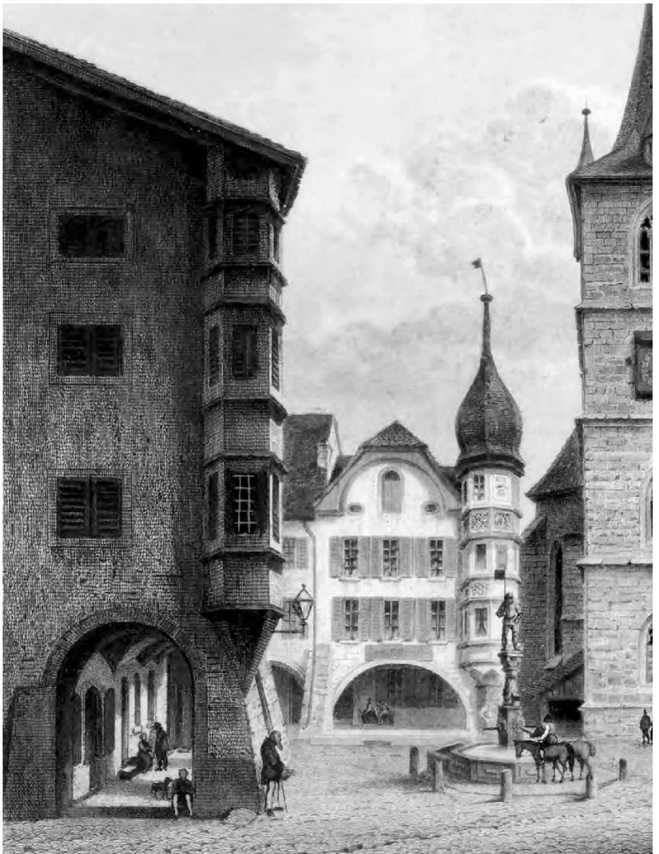
Der Ring (runder Platz vor der Stadtkirche) ist der älteste Teil der Stadt Biel. Von Christian Koehler (1809–1861), Ring in Biel mit Stadtkirche und dem Zunftthaus zu Waldleuten [Ausschnitt] . – Eigentum der Stadt Biel, Sammlung Museum Schwab.