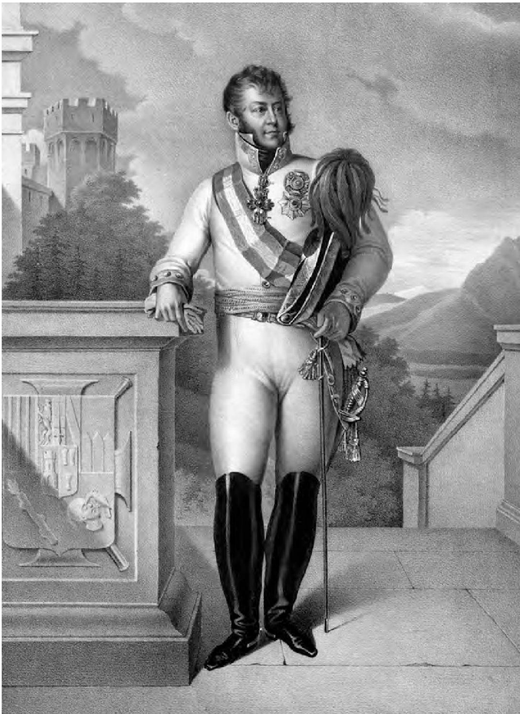
Feldmarschall Karl Philipp Fürst von Schwarzenberg (1771–1820), Kommandant der südlichen Heeresabteilung der Koalitionsarmee 1813/14.