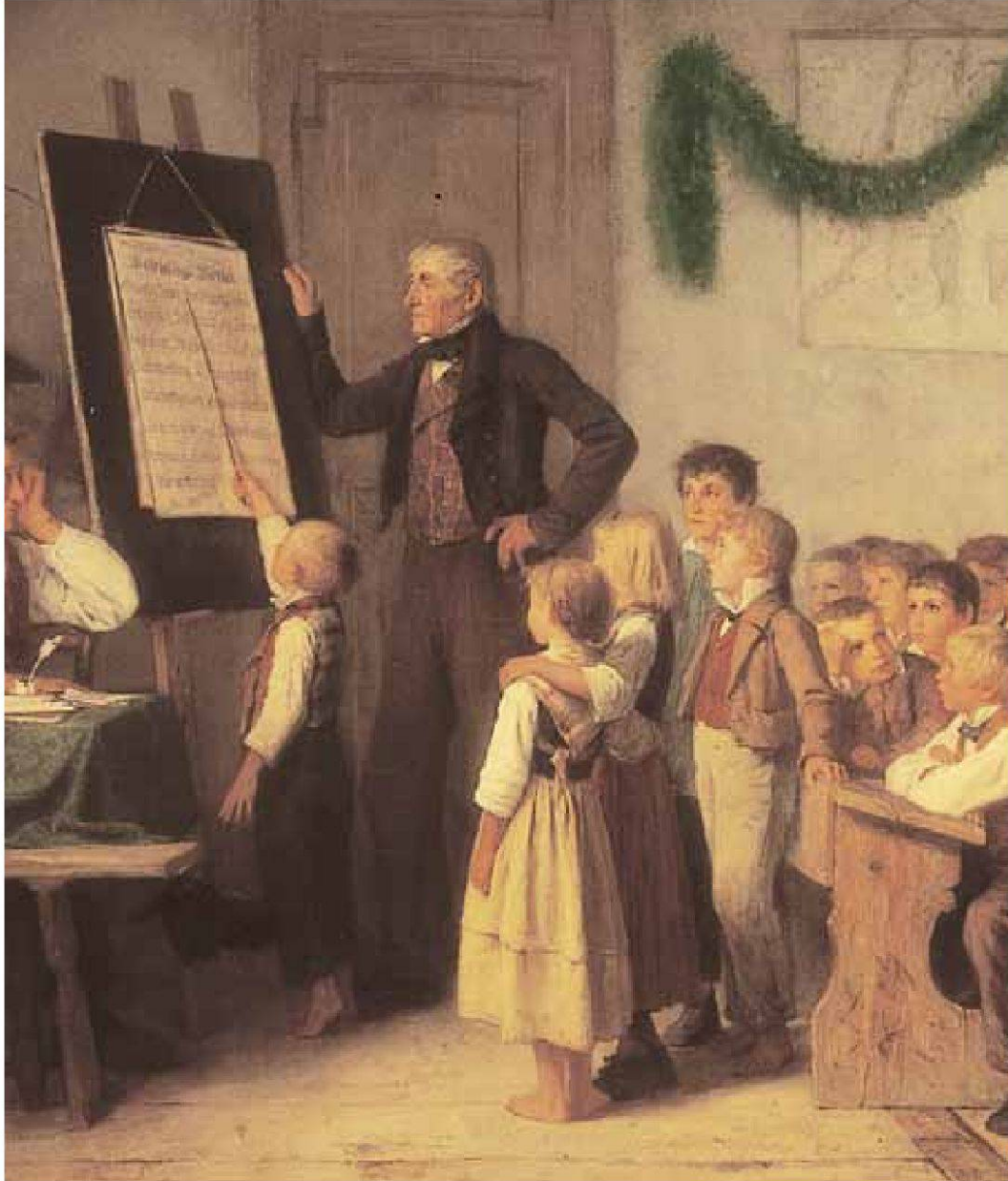
Albert Anker, Das Schulexamen , 1862, Öl auf Leinwand, 103 x 175 cm, Kat. Nr. 61 [Ausschnitt]. – Staat Bern, Kunstmuseum Bern .