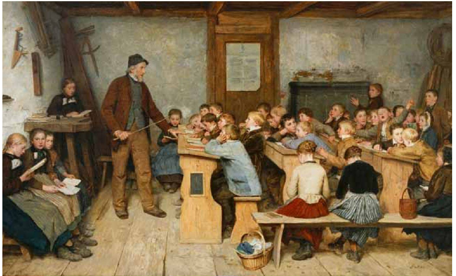
Albert Anker, «Dorfschule von 1848», 1895/96, Öl auf Leinwand, 104x 175,5 cm, Kat. Nr. 503. – Depositum Öffentliche Kunstsammlung Basel. Reproduktion mit der freundlichen Genehmigung der Novartis AG, Basel