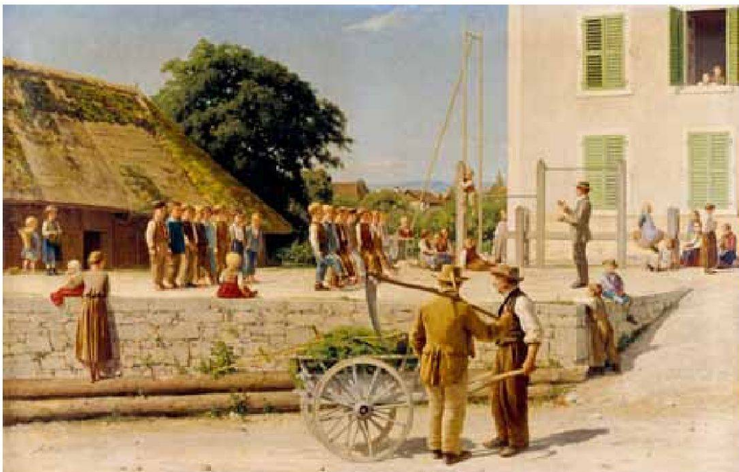
Albert Anker, Dorfschule im Schwarzwald, 1858, Öl auf Leinwand, 105 x 171 cm, Kat. Nr. 30. – Gottfried-Keller-Stiftung, Kunstmuseum Bern.