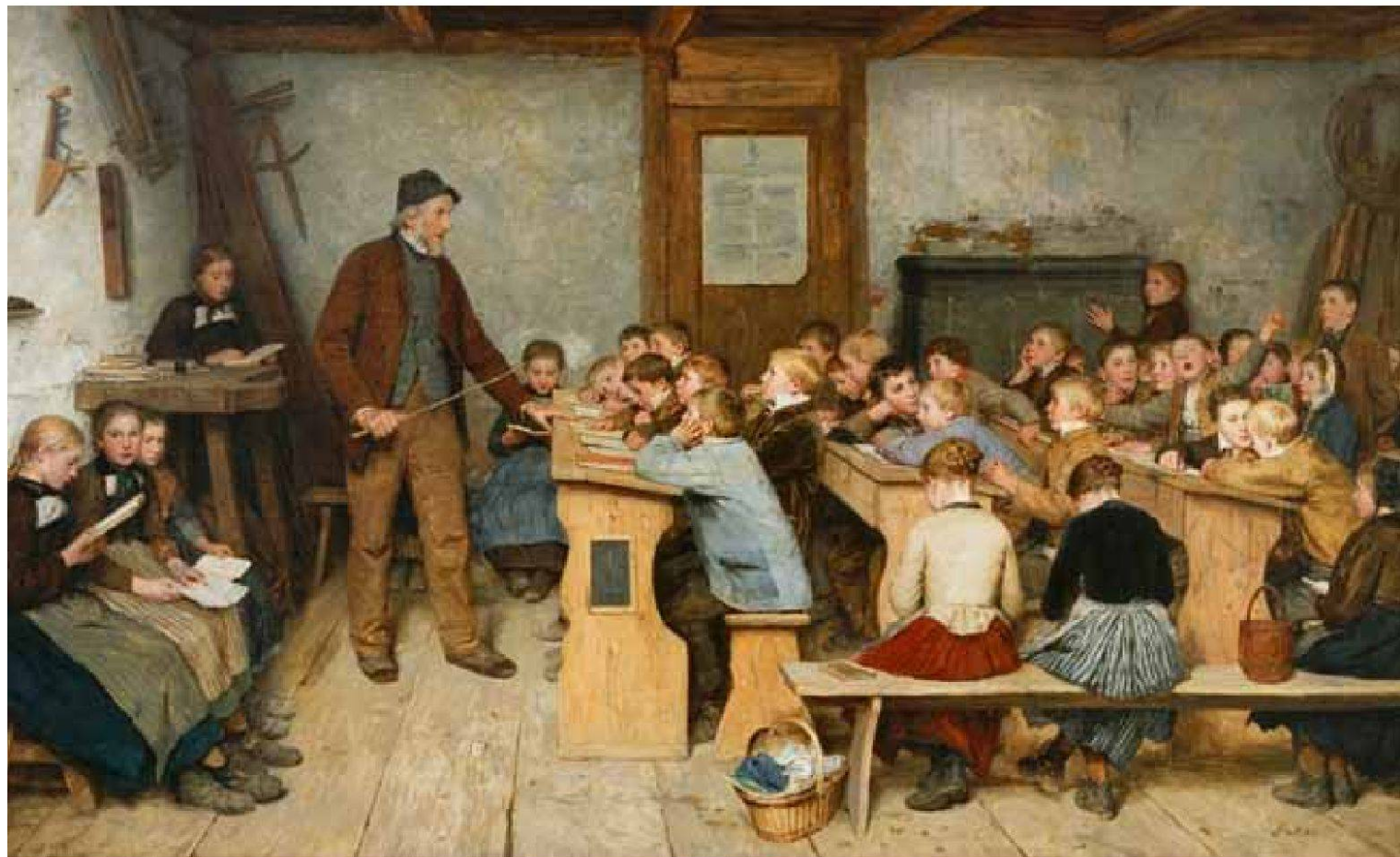
Albert Anker, «Dorfschule von 1848», 1895/96, Öl auf Leinwand, 104x 175,5 cm, Kat. Nr. 503. – Depositum Öffentliche Kunstsammlung Basel. Reproduktion mit der freundlichen Genehmigung der Novartis AG, Basel