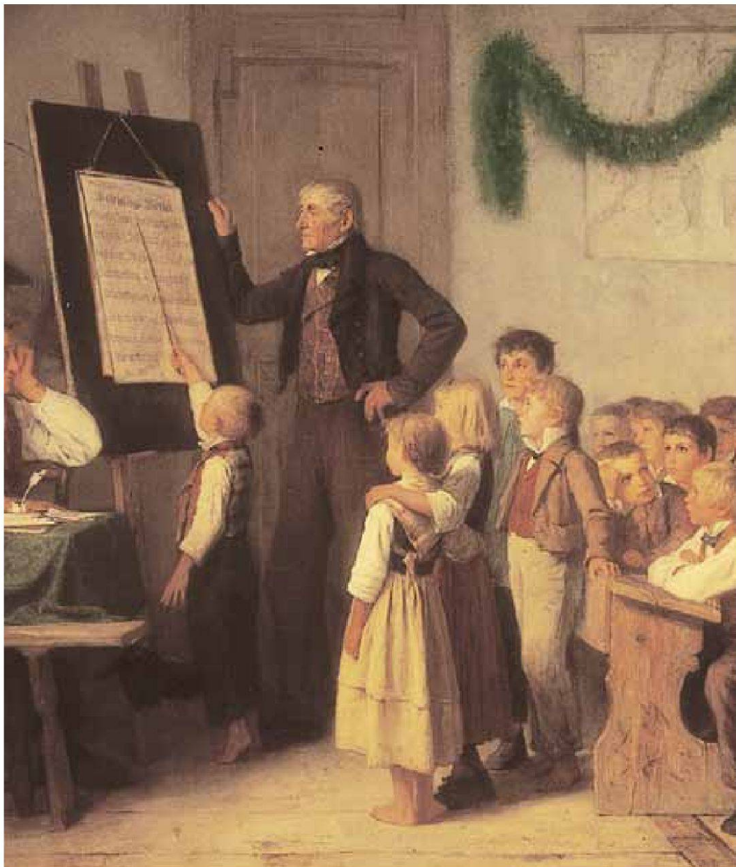
Albert Anker, Das Schulexamen, 1862, Öl auf Leinwand, 103x175 cm, Kat. Nr. 61 [Ausschnitt]. – Staat Bern, Kunstmuseum Bern.