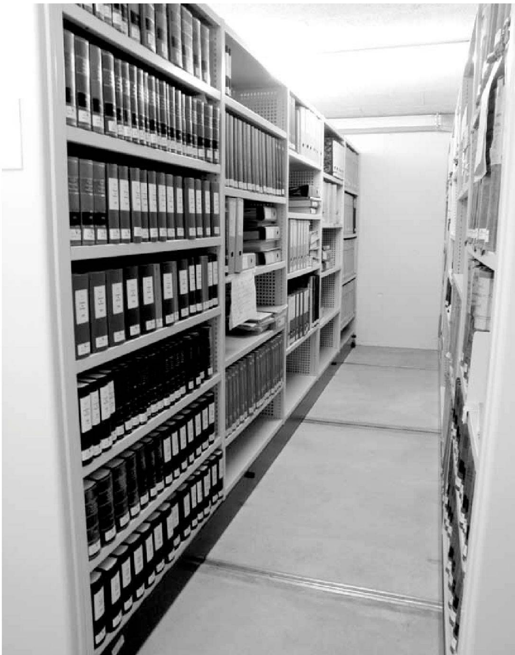
Empfang, Lesesaal und Archivraum mit Rollgestellanlage. Fotos von Yvonne Bischoff, Stadtarchiv Bern, 2009. – SAB.