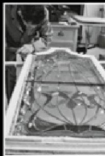
nachher fertig saniert

Zum Beispiel: Jugendstil-Fenster-Sanierungen /Ausführung