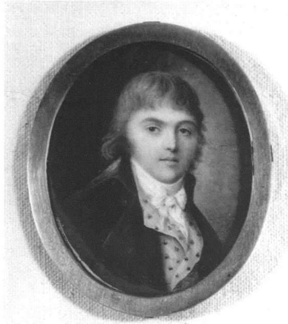
Abb. 4 Rudolf Emanuel Effinger von Wildegg (1771–1847) – der konservative Haudegen Oberamtmann von Konolfingen 1808 bis 1813 und von Wangen 1823 bis 1831 (Gemälde um 1800)

1771 geboren, verliess Rudolf Emanuel Effinger früh das väterliche Schloss Wildegg im Aargau. Nach einem Aufenthalt im Pensionat Rahn in Aarau besuchte er die Pfeffelsche Kriegsschule in Colmar und die Karlsakademie in Stuttgart, die alle als fortschrittliche Erziehungsanstalten galten. 1789 trat er in die holländische Schweizergarde ein. 1793 nahm er als unbezahlter Volontär an einem preussischen Feldzug im Elsass teil. Seine Begeisterung für die fremden Dienste war so gross, dass sein Vater ihn nicht zur Rückkehr in die Schweiz bewegen konnte.