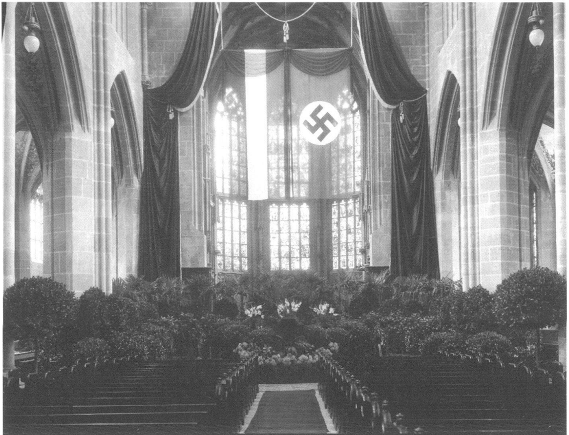
Abb. 4 Die Ortsgruppe der NSDAP veranstaltete 1934 im Berner Münster eine Trauerfeier zu Ehren des verstorbenen Reichspräsidenten Hindenburg. Vor dem Chor hing die Hakenkreuzfahne, und im Mittelschiff sassen zahlreiche offizielle Gäste, darunter auch vier Bundesräte.