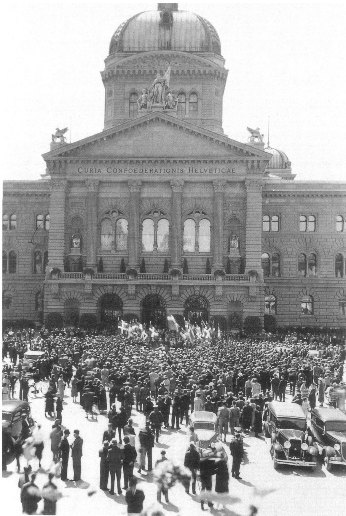
Abb. 3 Der grösste Gautag der Nationalen Front fand am 23. Mai 1937 in Bern statt. Nach der unbewilligten Demonstration auf dem Bundesplatz folgte ein Umzug mit Musik und Fahnen durch die Stadt. Es kam zu einem Zusammenstoss mit der Polizei.