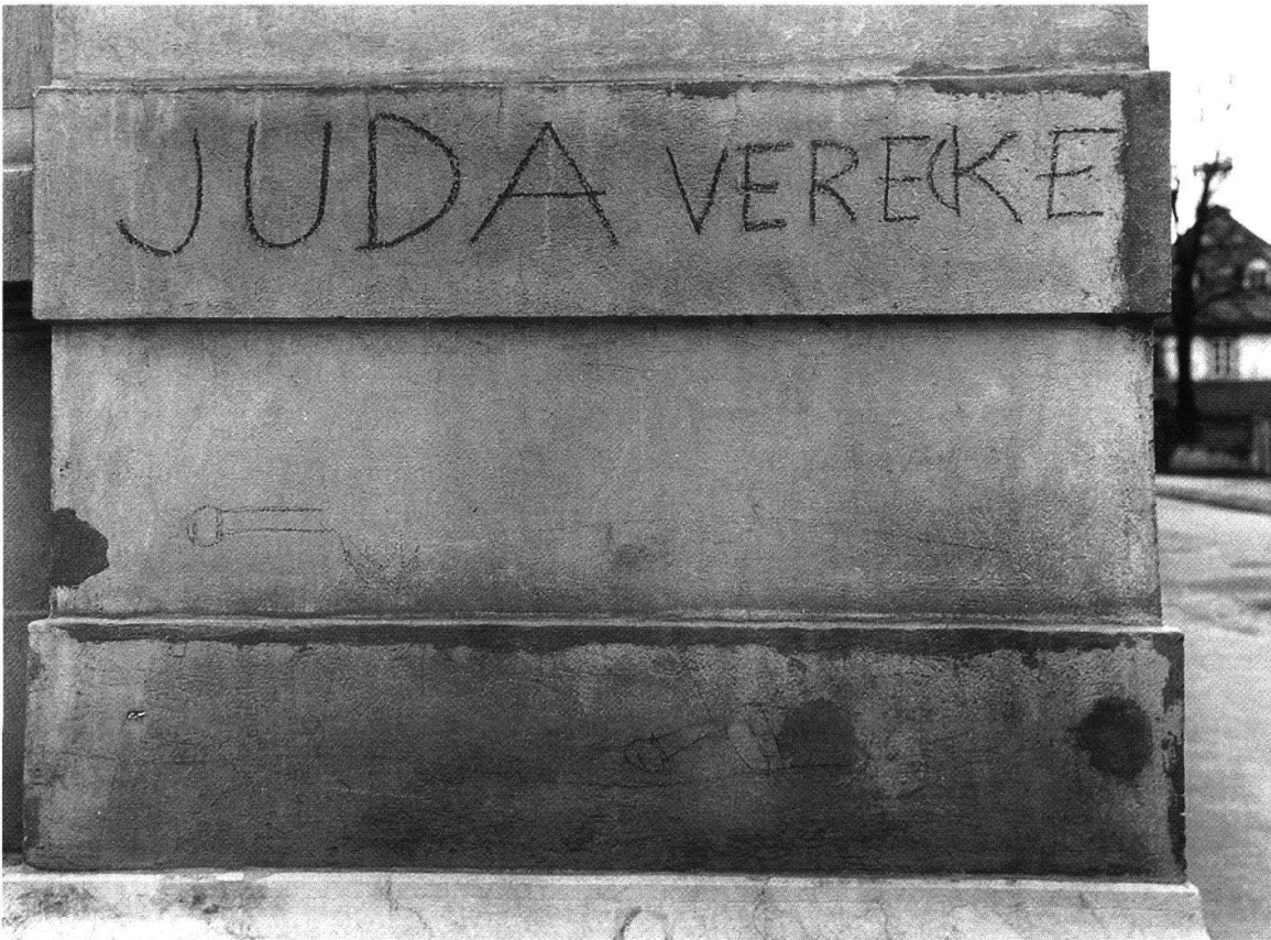
Abb. 2 1937 verschmierten Mitglieder der Nationalen Front in Bern öffentliche Gebäude, darunter auch die Synagoge, die hier abgebildet ist. Die Berner Frontisten wurden dafür juristisch und politisch verurteilt.

in Bezug auf die Schadenersatzpflicht einigen. Somit hatte das Gericht nur noch über die Schuldfrage zu befinden. Der Verteidiger plädierte für eine mildere Bestrafung der Frontisten – ohne Erfolg: Das Obergericht bestätigte den erstinstanzlichen Entscheid. Sämtliche Angeeschuldigten wurden sogar der Mittäterschaft statt nur der Gehilfenschaft schuldig erklärt. Das Gericht hielt fest, dass die «Malaktion» der Nationalen Front von langer Hand vorbereitet und die Rollen planmässig verteilt worden waren. 93