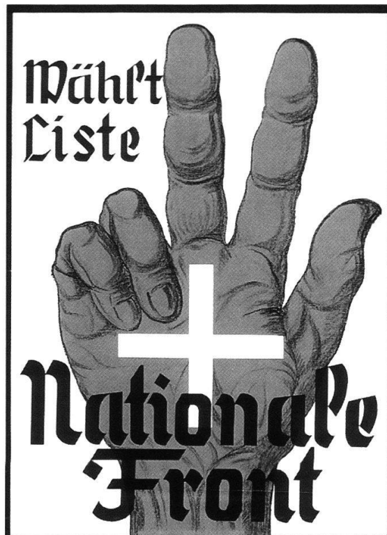
Abb. 1 Plakat der Nationalen Front für die Grossratswahlen vom 6. Mai 1934. Gegen Doppelverdiener, für den Kleinhandel und für tiefere Mietzinse: Diese Versprechen der Nationalen Front im Grossratswahlkampf 1934 überzeugten nur wenige Berner. Bloss 1,6 Prozent der Stimmen vermochte die Partei in der Stadt Bern für sich zu gewinnen.

erpresserischen Methoden über und veröffentlichte just drei Tage vor den Grossratswahlen in der «Front» Namen von doppelverdienenden Ehepaaren, wobei das Einkommen der Eheleute jeweils separat aufgelistet wurde. 81