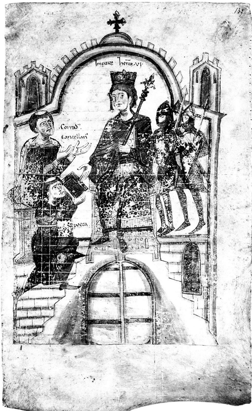
Abb. 4: Der Dichter, begleitet vom Kanzler, überreicht Kaiser Heinrich VI. das Buch. (Burgerbibliothek Bern, Cod. 120 II, Petrus de Ebulo, Bl. 139).