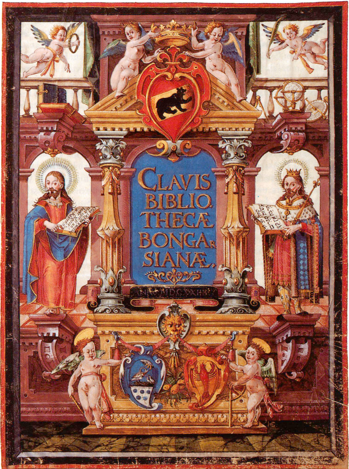
Abb. 2: Titelblatt zum Katalog der Bongarsiana von 1634 (Bürgerbibliothek Bern, Cod. A 5).