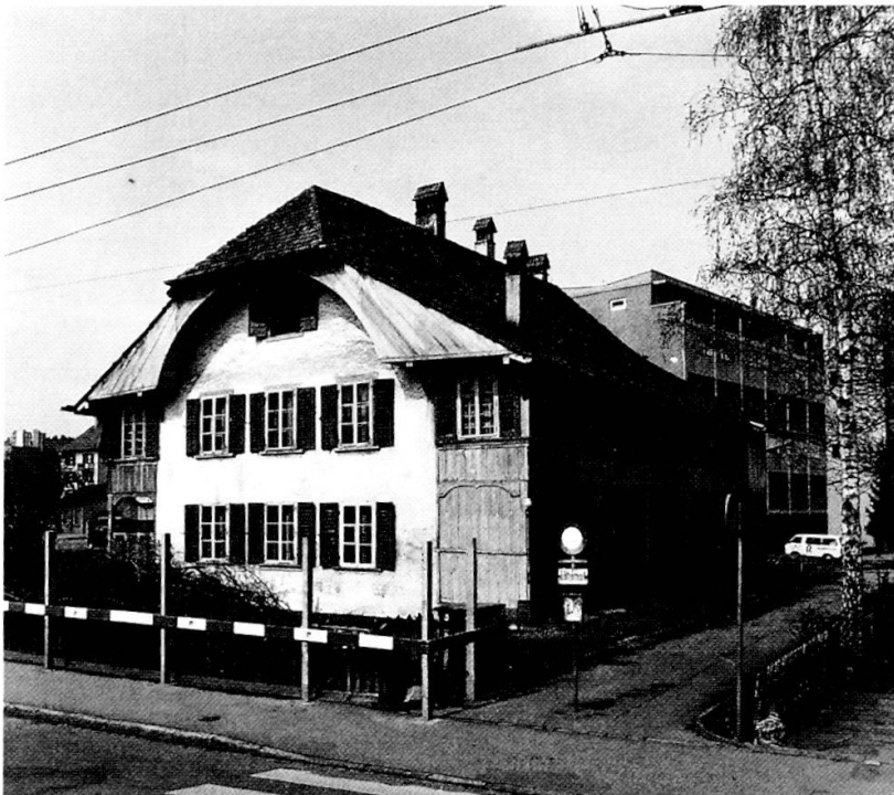
Das Pfarrhaus Bümpliz unmittelbar vor dem Abbruch 1986.

304 Johanna Strübin: Quellenauszüge und Manuskript: Das alte Pfarrhaus Bümpliz. Ferner: Geschichtliches zum Alten Pfarrhaus Bümpliz nach Paul Loeliger, in der Bümplizer Zeitung vom 19. Juni 1986.