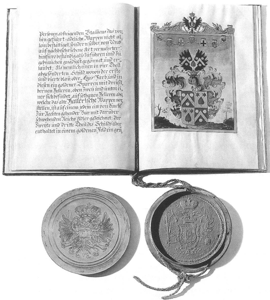
Abb. 5 Die Nobilitierung sollte den Berner Gelehrten für seine wissenschaftlichen Leistungen ehren und an den Göttinger Landesherren binden, widersprach jedoch dem Selbstverständnis der bernischen Stadtrepublik. Albrecht von Hallers Adelsdiplom mit kaiserlichem Siegel, ausgestellt 1749 durch die Hofkanzlei in Wien. Burgerbibliothek Bern, Nachlass Albrecht von Haller 131. – Original in Privatbesitz.

Problematisch erschien zudem an den Adelsbriefen, dass diese nicht nur auf Personen, sondern auch auf deren Geschlechter ausgestellt waren; würde man dies stillschweigend dulden, könne es sein, dass diese Familien «sich über ihre Mitbürger unbegründet überheben könnten». Aus diesen Gründen empfahl die Kommission, dass diese Diplome zwar nicht generell zu verbieten seien, doch weder im Innern noch im Ausland bei Strafe gegenüber anderen Bürgern zur Höherstellung gebraucht werden dürften.