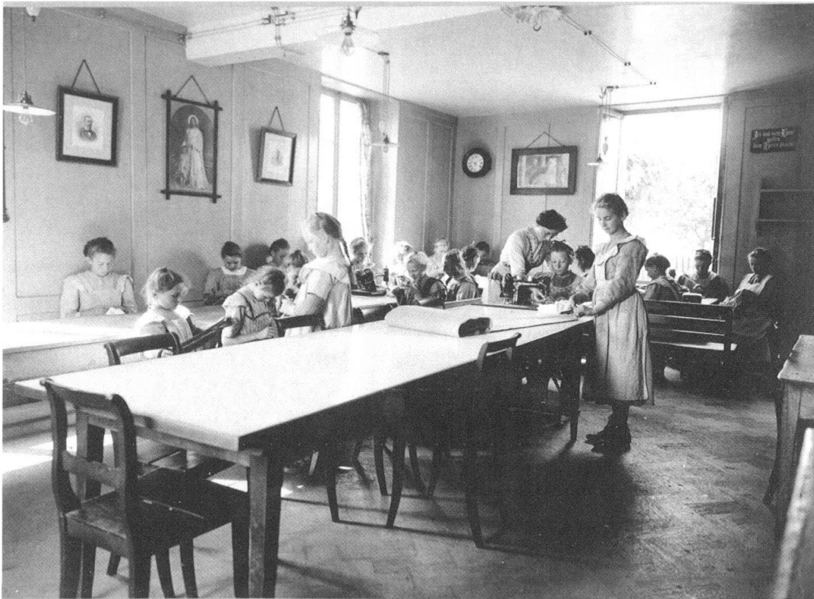
Abb. 3 Mit Stolz präsentierte der Kanton Bern an der Landesausstellung von 1914 seine Armeninstitutionen, darunter auch die Armenerziehungsanstalt für Mädchen Steinhölzli in Bern. Allerdings war die Zahl der Kinder, die in solchen Heimen lebten, relativ gering im Vergleich zu jenen, die in Pflegefamilien untergebracht wurden.

durch Naturalien und, seltener, auch durch Bargeld aus der städtischen Armenkasse unterstützt wurden. Zweitens die Verköstigung, das heisst die Unterbringung der verarmten Personen in einem fremden Haushalt, wobei die Armenkasse die Pflegefamilie für die Unterbringung, Pflege und Ernährung des Kostgängers oder der Kostgängerin bezahlte. Drittens die Anstaltspflege, die Unterbringung der Armen in einem Heim oder einer Armenanstalt.