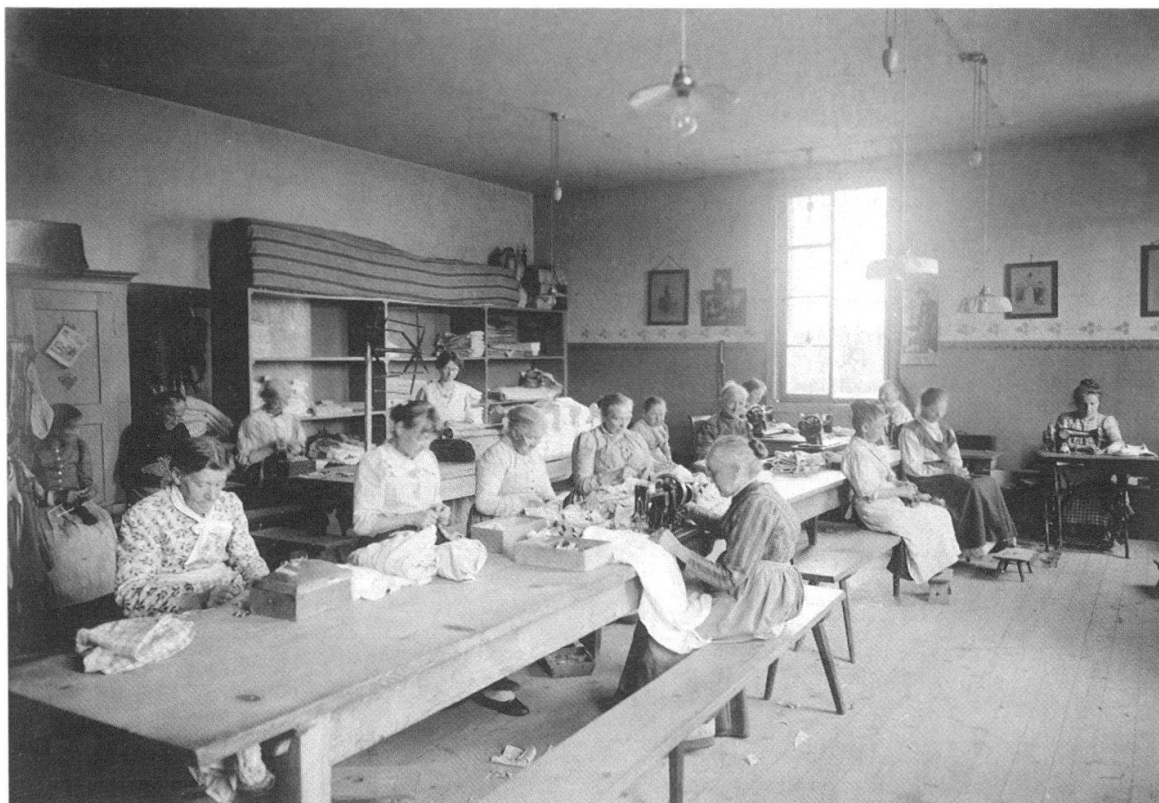
Abb. 4 Armenanstalt Kühlewil auf dem Längenberg 1914: Das Nähatelier war mit modernen Nähmaschinen ausgestattet. Die Frauen waren vor allem hier und in der Hauswirtschaft beschäftigt.

nungsjahr stieg die Zahl der Insassen auf 312 29 und nahm im nächsten Jahrzehnt noch leicht zu, auf rund 350 Personen im Jahr 1902. 30