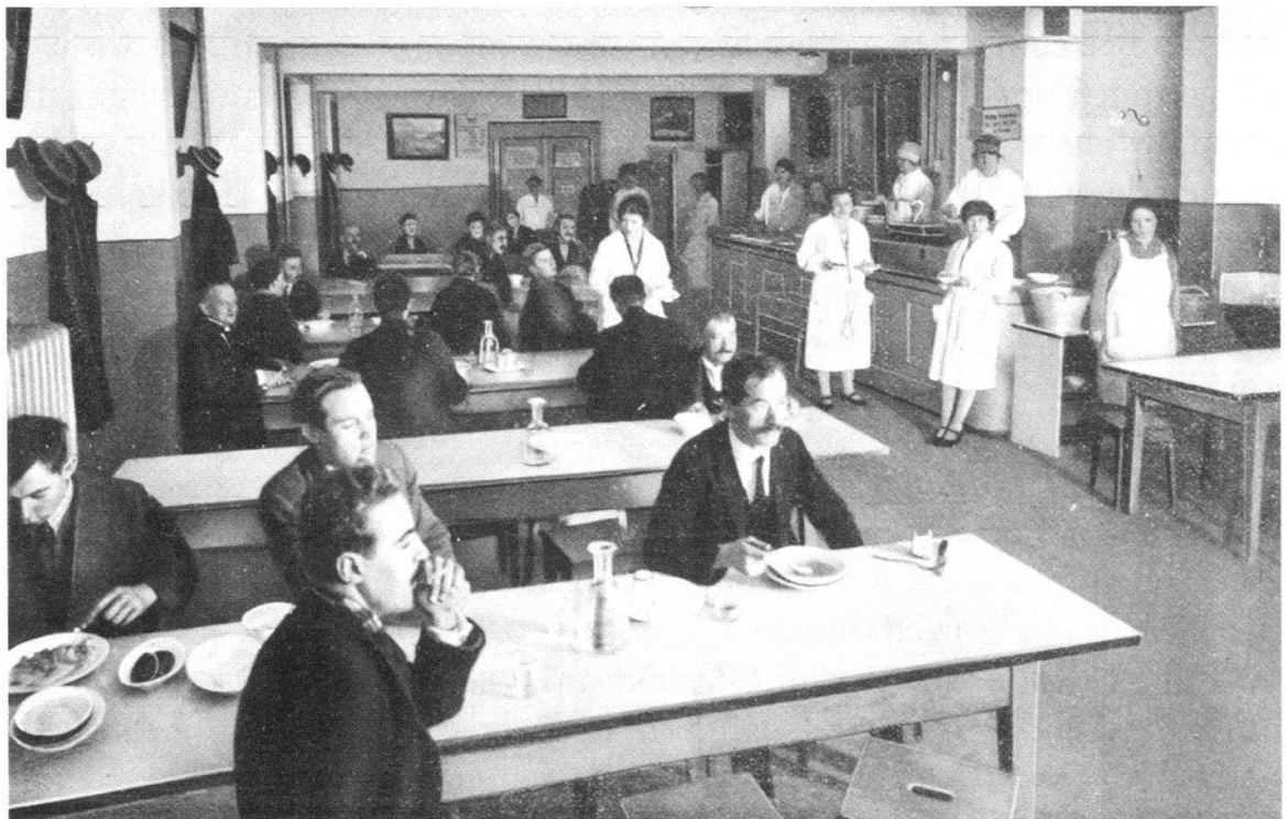
Abb. 2 Angesichts der wachsenden Not in der Stadt Bern entstanden in den 1870er- und 1880er-Jahren auch private Wohltätigkeitsinstitutionen wie die 1877 gegründete Speiseanstalt «Spysi» in der unteren Altstadt, wo den Armen warme Mahlzeiten angeboten wurden. Diese Aufnahme stammt aus dem Jahr 1928.

Auf diese Vorteile der freiwilligen Armenpfleger und -pflegerinnen wollte und konnte man in Bern auch nach 1888 nicht verzichten. Die Ge-