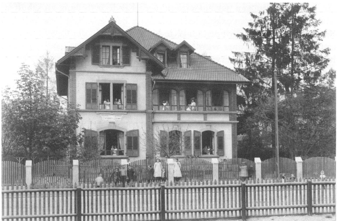
Abb. 7 Die 1880 gegründete Kinderkrippe in der Länggasse wurde ab 1898 durch die Stadt Bern subventioniert. Das vorliegende Bild stammt ebenfalls aus einem Album für die Landesausstellung von 1914.

Das Problem der Kinderbetreuung stellte sich indes nicht nur bei den Schulkindern, die in den Horten beaufsichtigt wurden, sondern mindestens ebenso dringlich bei den Kleinen, für die in den Neunzigerjahren erst vier private Krippen in der Altstadt (seit 1873), in der Lorraine (seit 1874), in der