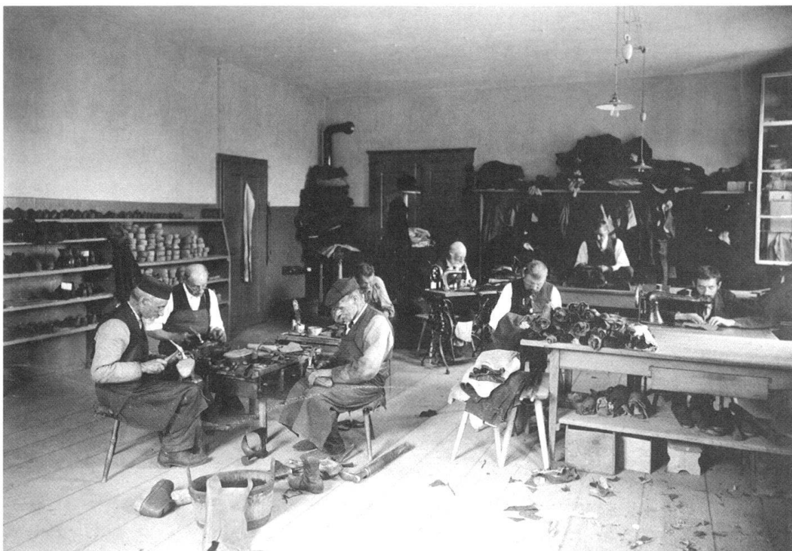
Abb. 5 Das Schusteratelier der Männer in der städtischen Armenanstalt Kühlewil. Das Bild wurde ebenfalls für die Landesausstellung von 1914 gemacht. Die männlichen Insassen mussten in der Landwirtschaft und in den Werkstätten der Anstalt mitarbeiten.

Im Februar 1887 reichten der Grütliverein, die Arbeiterpartei und der allgemeine Arbeiterverein im Berner Stadtparlament eine Petition ein, in der sie die Schaffung einer unentgeltlichen öffentlichen Arbeitsvermittlungsstelle forderten. An sie sollten sich arbeitslos gewordene Männer und Frauen wenden können, um rascher wieder eine Stelle zu finden. Der Grosse Stadtrat setzte eine Kommission ein, die das Anliegen prüfte. In einem umfassenden Bericht, in dem sie nicht nur die Situation auf dem bernischen Arbeitsmarkt analysierte, sondern auch über Erfahrungen mit Arbeitsvermittlungsstellen in anderen Städten im In- und Ausland berichtete, befürwortete die Kommission die Schaffung einer städtischen Stelle für Arbeitsvermittlung und legte einen entsprechenden Vorschlag vor, den der Gemeinde- und der Stadtrat guthiessen. Zu Beginn des Jahres 1889 nahm die Anstalt für Arbeitsnachweis den Betrieb auf. Der Erfolg der neuen Einrichtung hielt sich anfänglich in engen Grenzen. Die Arbeitssuchenden nahmen dieses Angebot nur zögernd in Anspruch, und die Arbeitgeber bevorzugten die herkömmlichen Wege der Personalrekrutierung. Vor allem bei den Männern war die Vermittlungsquote mit rund einem Viertel der Stellensuchenden zudem nicht sehr hoch, während bei den Frauen auf diesem Weg immerhin etwa drei Viertel eine neue Stelle fanden. Ein Grund für die Startschwierigkeiten der Arbeitsvermittlungsanstalt war wohl auch die Tat-