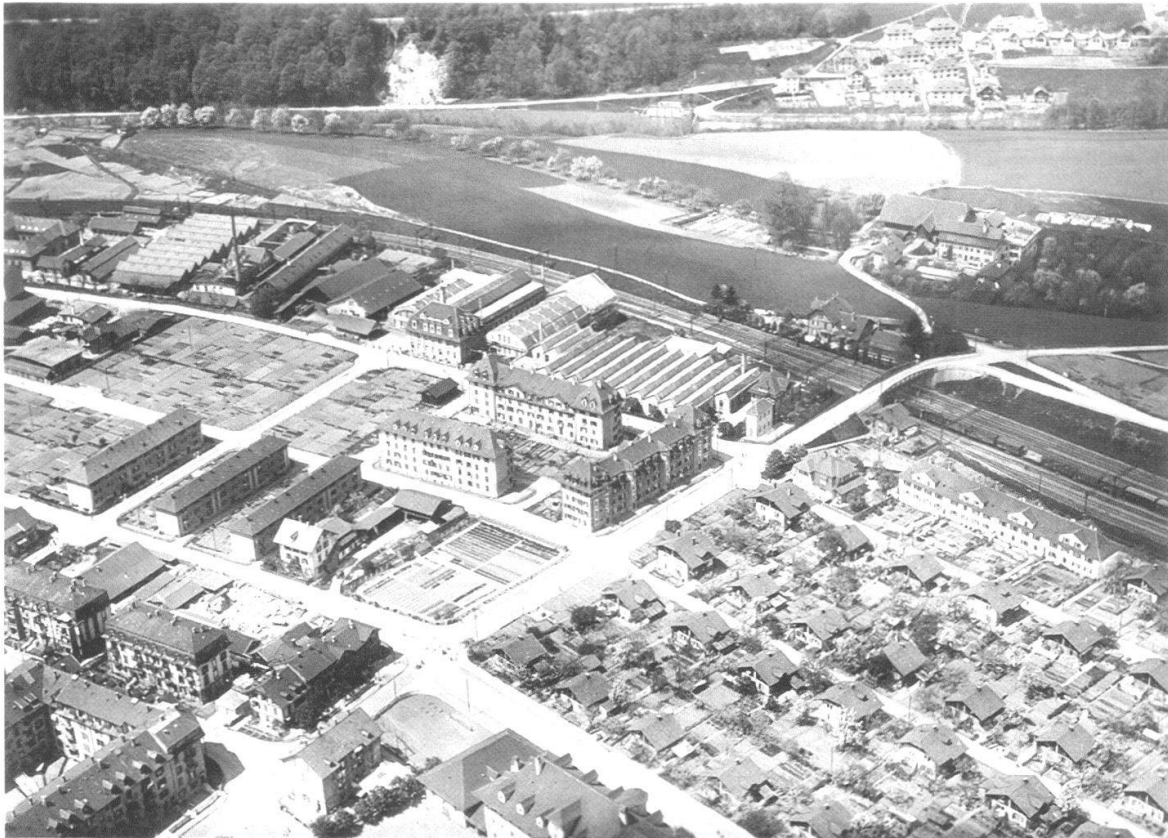
Abb. 6 Die städtische Arbeitersiedlung Wylerfeld, rechts unten im Bild zwischen Standstrasse, Scheibenstrasse und Wylerringstrasse, auf einer Luftaufnahme um 1930. Die Siedlung war ein sehr frühes Beispiel kommunalen sozialen Wohnungsbaus. Die Zweifamilienhäuser mit grossen Gärten mussten ab 1956 grossen Wohnblöcken und dem Quartierzentrum Wylerhuus weichen.